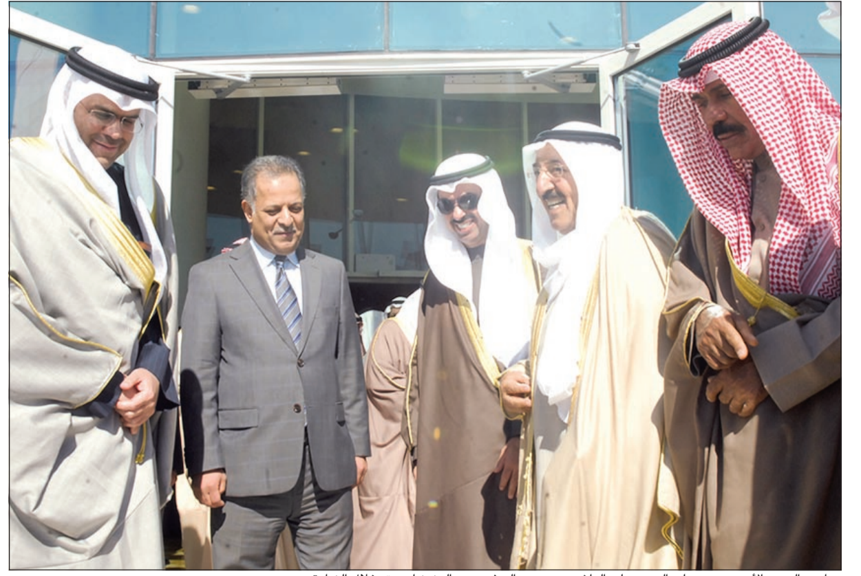
صاحب السمو الأمير وسمو ولي العهد وعلي الراشد ودمحمد الهيفي وعبدالعزیز إسحق خلال الزيارة

أكد أن تكلفته بلغت 14 مليون دينار و240 ألفاً بمساحة 20 ألف متر مربع ويتكون من 8 طوابق