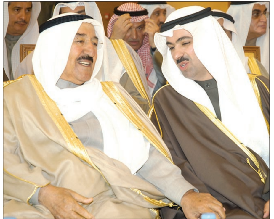
حديث بين صاحب السمو الأمير وعلي الراشد

لأبنائكم ولشعبكم ونبتل له عز وجل أن يحفظ الكويت عزة وكرامتها ويديم علينا جميعاً نعمة الخير والأمان في ظل القيادة الرشيدة والحكمة. وترفع خالص الشكر والتقدير لصاحب السمو الأمير الشيخ صباح الأحمد وسمو ولي العهد الأمين الشيخ نواف الأحمد وسمو رئيس مجلس الوزراء الشيخ جابر المبارك حفظهم الله لرعايتهم الدائمة وللخدمات الصحية والتوجيه الدائم منهم برفع مستوى ما تقدمه الوزارة من خدمات سواء للمواطنين أو لكل من يقبل على أرض الكويت الغالية.