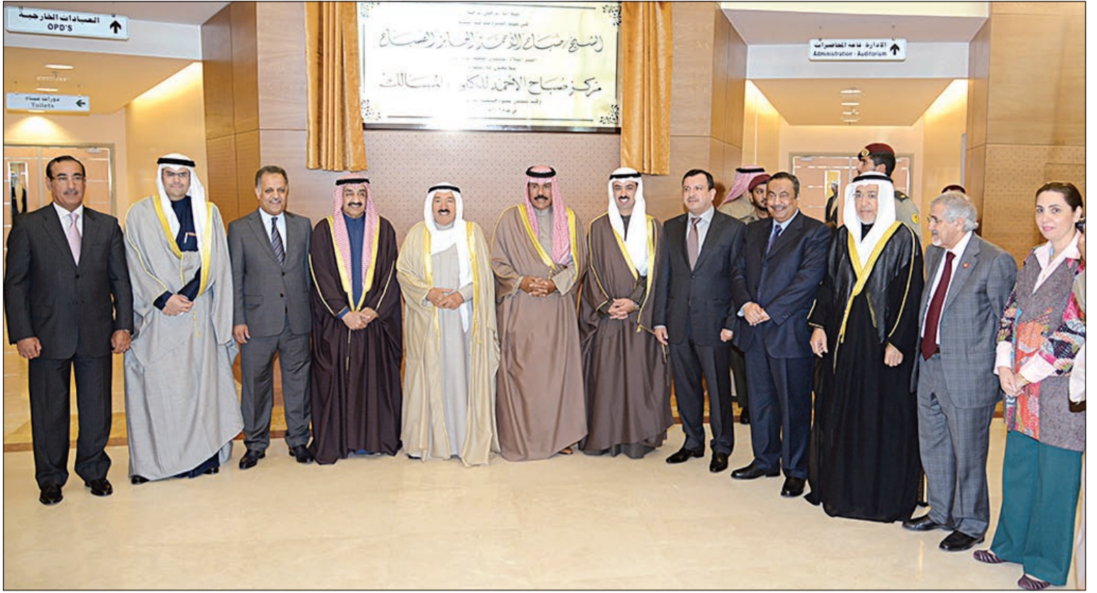
صاحب السمو الأمير الشيخ صباح الأحمد وسمو ولي العهد الشيخ نواف الأحمد وعلي الراشد وجاسم الخرافي ومحمد الهيفي ودرولا دشني وعبدالعزیز إسحق ود. خالد السهلاوي ود. قيس الدويري ود. هلال السابر خلال افتتاح المركز

خلال حفل حضره ولي العهد والراشد والخرافي وكبار الشيوخ والوزراء