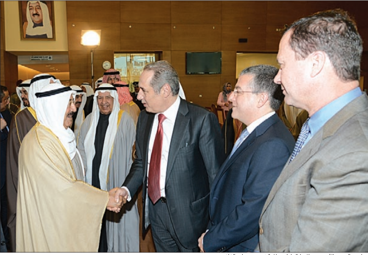
صاحب السمو الأمير مصافحا العاملين بالمركز ويبدو علي الغام