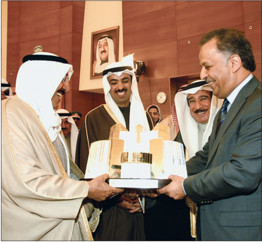
صاحب السمو الأمير يتسلم هدية تذكارية من محمد الهيفي بحضور علي الراشد