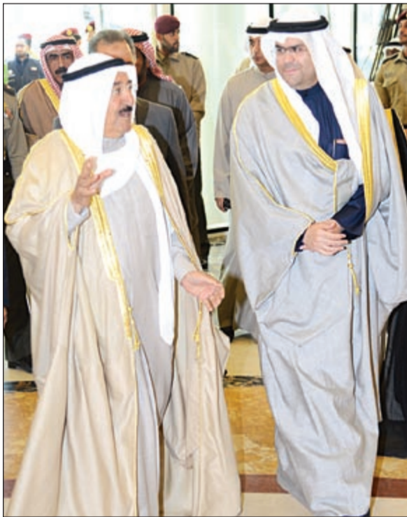
صاحب السمو الأمير الشيخ صباح الأحمد وعبدالعزیز إسحق خلال الزيارة