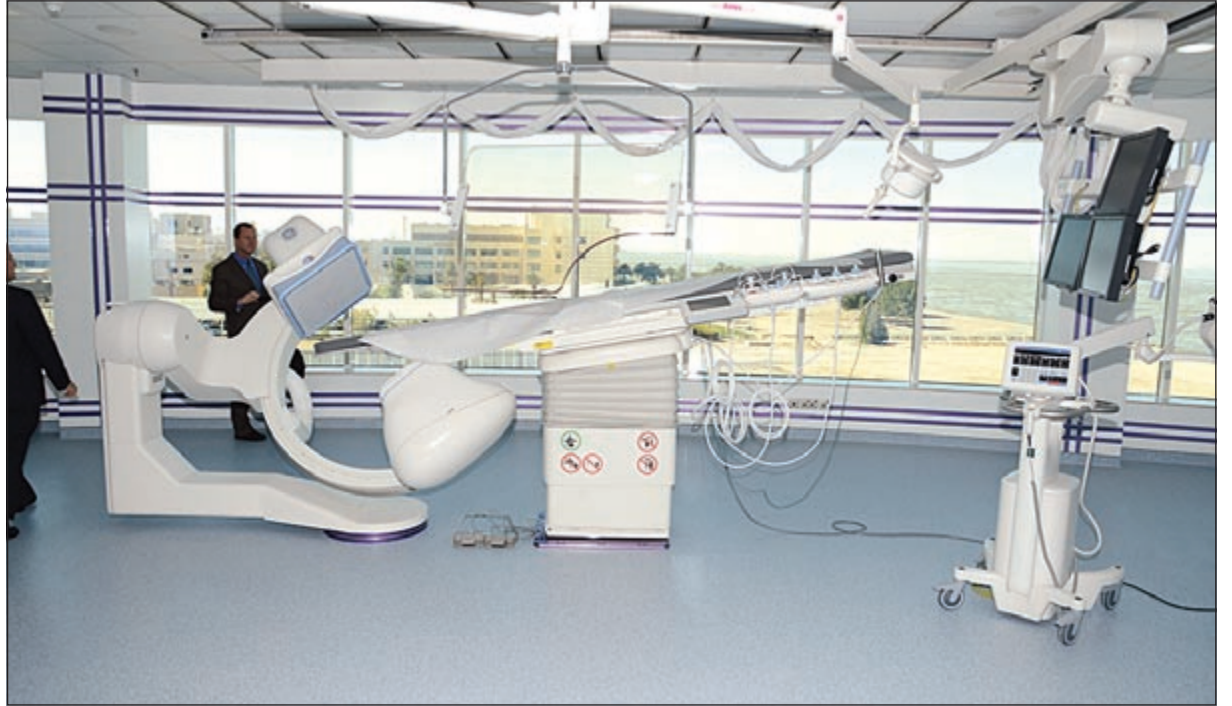
جهاز حديث للأشعة