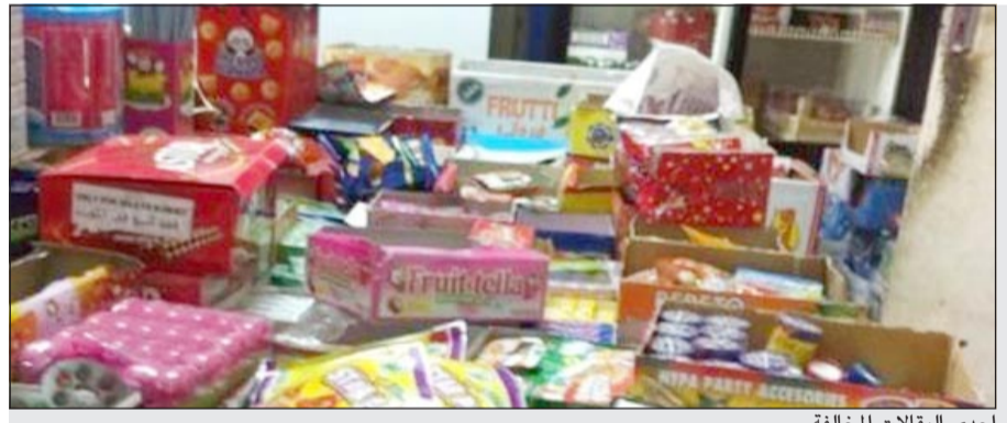
إحدى البقالات المخالفة

عدد 8 منهم وقاموا بإخلائها الى جانب إخلاء إحدى المصابغ في منطقة الدوحة بعد ورود عدة شكاوى من قاطني المنطقة. ودعا القطن اصحاب المنازل الى التعاون مع جهاز البلدية من خلال الابحان لأصحاب تلك البقالات المخالفة بسرعة اخلائها والاستجابة لانذارات فريق طوارئ العاصمة، لافتاً الى انه في حال عدم الاستجابة سيتم اتخاذ جميع الإجراءات القانونية المنتملة في قطع التيار الكهربائي عن تلك المنازل وذلك بالتعاون مع الجهات المعنية.