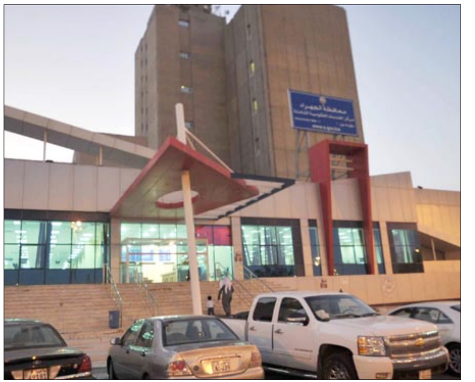
مبنى مركز الخدمة داخل «الحكومة مول»