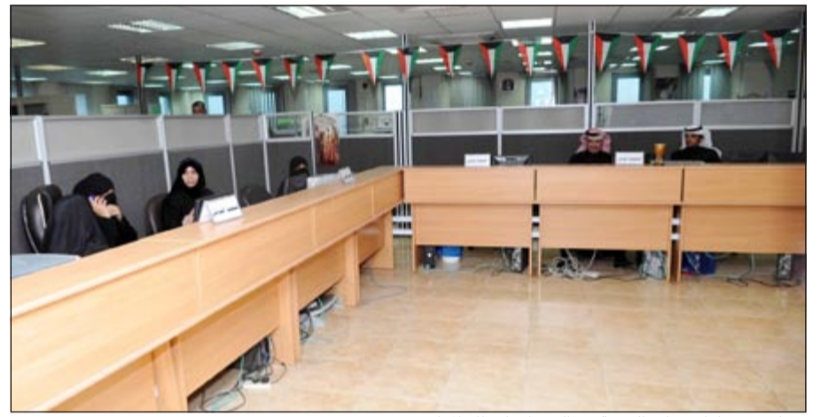
موظفو وموظفات مركز الخدمة في الجهراء بانتظار المراجعين