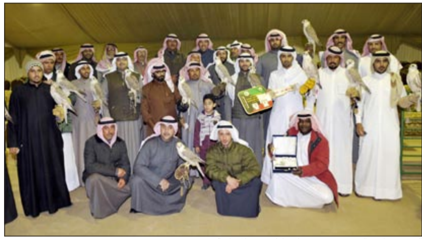
الشيخ ضاري الفهد مع عدد من المشاركين في المسابقة