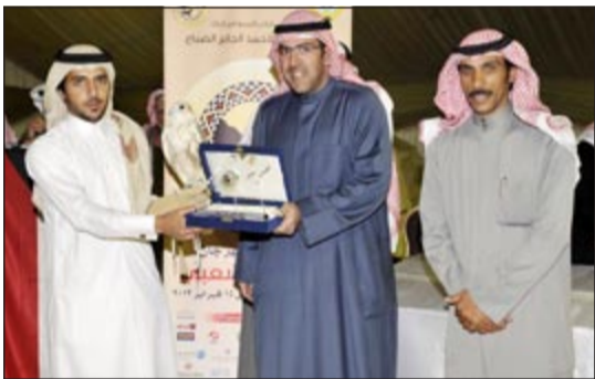
تكريم أحد الفائزين

حيث تواصلت مسابقة الشعل 30 لليوم الثاني على التوالي حيث شارك في هذه المنافسة أكثر من 35 متسابقاً شارك كل منهم بأحد الأبل التي يقتنصها من لون الشعل بعدد 30 ناقة لكل متشارك. وأشار الناصر إلى أنه تم تأجيل مسابقة الشعل من الفترة الصباحية إلى فترة العصر بسبب سوء الأحوال الجوية حيث انتهت لجان التحكيم من اختيار الفائزين بالمراكز الأولى قبل غروب الشمس، مشيراً إلى أن الجدول الزمني للمهرجان يسير حسب ما تم رسمه وأن كافة مسابقات الأبل التي أقيمت في الأيام السابقة تم الانتهاء منها ولم يتم تأجيل أية مسابقة، موضحاً أن الإعلان عن الفائزين في مسابقات الأبل سيكون في نهاية المهرجان.