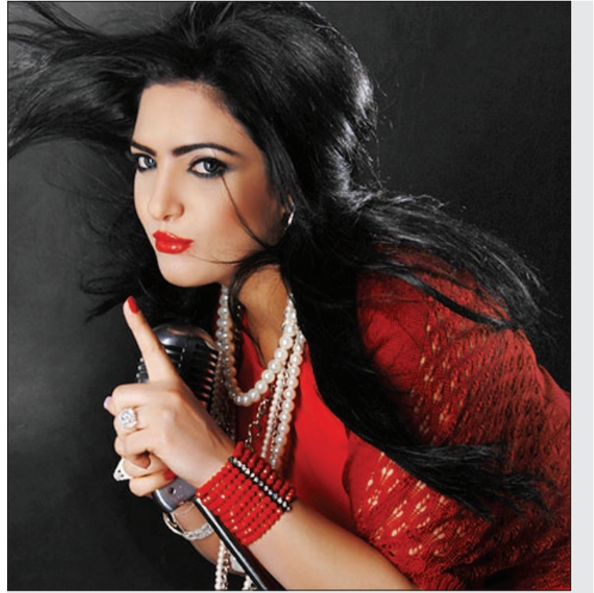
المطربة الكويتية سينا الفارس