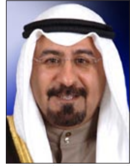
الشيخ د. محمد الصباح

واستخدام أحدث الأساليب التكنولوجية. وقالت م. لاري ان وزير الخارجية السابق الشيخ د. محمد الصباح سيحدث بمحور الشباب باليوم الأول للمؤتمر كمتحدث رئيسي حيث يركز على جهود الشباب ودورهم في بناء الوطن وتطويره وكيفية السير بالوطن نحو التقدم الحضاري ومحاكاة التطور العالمي في جميع الميادين.