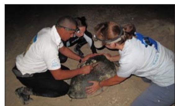
فريق حماية السلاحف البحرية خلال مشاركته في أعمال المنتدى

كشفت رئيس فريق حماية السلاحف البحرية التابع للجمعية الكويتية لحماية البيئة، عن مشاركة كويتية مميزة في المنتدى العالمي للسلاحف البحرية والذي انطلقت أنشطته أمس في ولاية ميرلاند بالولايات المتحدة الأمريكية.