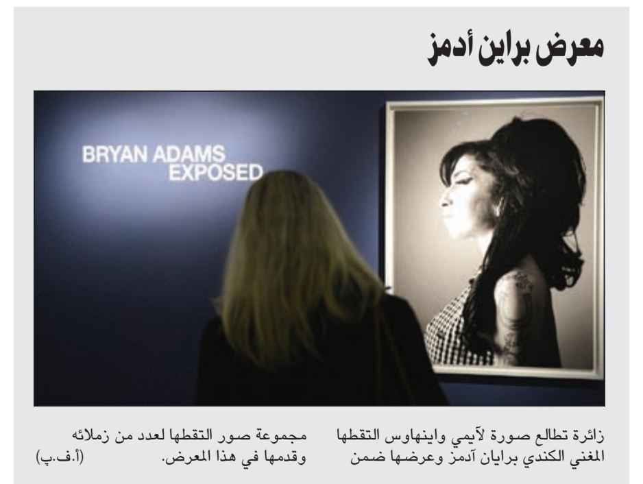
معرض براين آدمز

جوهانسبيرغ - د.ب.أ: قتل الصيادون بصورة غير مشروعة 57 من حيوانات وحيد القرن في جنوب أفريقيا خلال شهر يناير في الوقت الذي لاتزال فيه عمليات القتل غير المشروع لأنواع الحيوانات المهددة بالانقراض منتشرة والجهود المبذولة لمكافحة مثل هذه الحوادث تواجه مقاومة مسلحة شديدة من الصيادين الإجرامية. وقد لقي العديد من الصيادين المسلحين غير الشرعيين حتفهم في معارك بالأسلحة مع حراس حديقة كروجر الوطنية المترامية الأطراف في شمال البلاد. وقد اعتقلت السلطات 18 شخصا في الشهر الجاري لتورطهم في عمليات الصيد