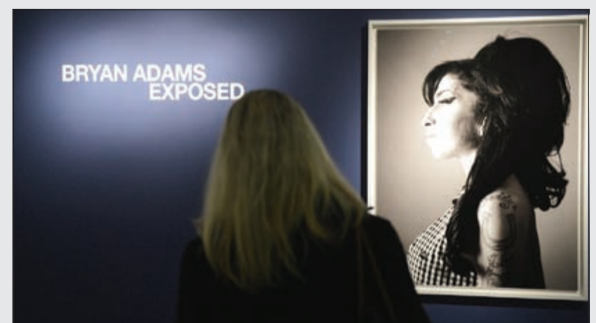
زائرة تطلع صورة لأمي واينهاوس التقطها المغني الكندي برايان آدمز وعرضها ضمن مجموعتها في هذا المعرض.