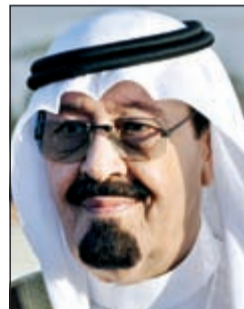
خادم الحرمين الشريفين الملك عبدالله بن عبدالعزيز

على الجدول الزمني لتوزيعها على جلسات المجلس في الاجتماع الذي يعقد غداً. وتوقعت المصادر ان يتم التصويت على مشروع قانون التامين ضد البطالة في حال رفعت اللجنة التقرير المطلوب الى المجلس ليكون «باكورة» أولويات القوانين المنفق عليها ويحسب هذا الانجاز للجنة المالية. هذا، وستقدم الحكومة رأيها في طلبات النواب لتشكيل 5 لجان تحقيق في قضايا جسر جابر ومحطة الزور وعقد الداو وترقيات «النفط» ومخالفات «الطب النفسي» الى جانب تكليف اللجنة الصحية