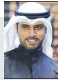
الروائي سعود السنعوسي