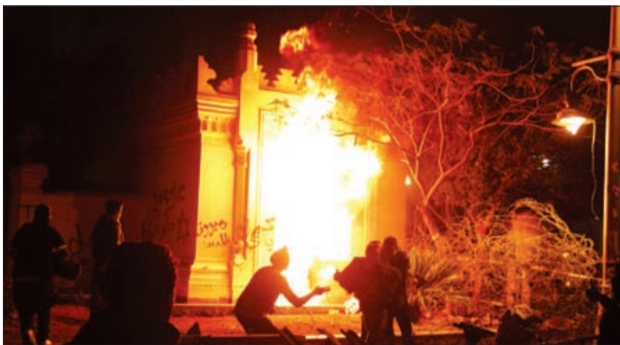
جزء من سور قصر الاتحادية الرئاسي اشتعل بالنيران بعد رشقه بالمولوتوف من قبل المحتجين أمس

الرئاسة المصرية: الأجهزة الأمنية ستتحرك «بمنتهى الحسم» لحماية منشآت الدولة تظاهرات غاضبة في مصر تطالب برحيل مرسي وقنابل «مولوتوف» على القصر الرئاسي