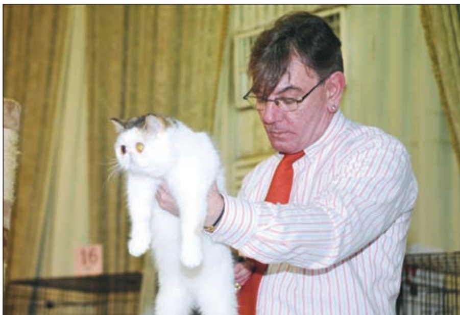
استعراض لاحدى القطط المتنافسة