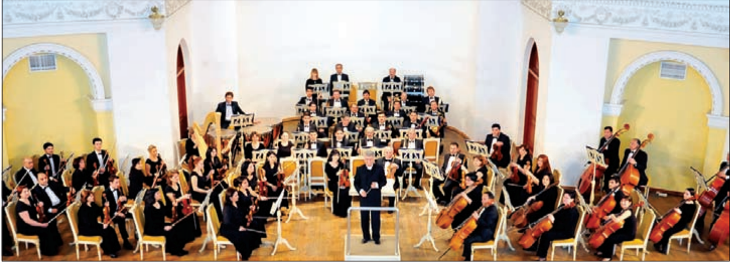
الأوركسترا السيمفونية الأذربيجانية

ويرامح موسيقية غنية ومتنوعة، وقد حصل شيرنياكوفسكي على لقب فنان الجمهور، وبطل الأعمال الموسيقية في عام 1928.