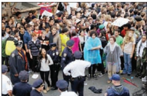
صورة أرشيفية لاحتجاجات «وول ستريت»

نيويورك - د.ب.أ: أفادت دراسة جديدة بأن الآلاف من المتظاهرين الذين احتشدوا للاحتجاج على «حشع» وول ستريت، وهو شارع المال والأعمال في مدينة نيويورك الأميركية، جاءوا من عائلات بيزيد دخلها عن مئة ألف دولار سنويا فضلا عن كونهم متعلمين جيدا. ونشأت حركة «احتلوا وول ستريت» في مدينة نيويورك عام 2010 ثم انتشرت في العديد من المدن الأميركية وحول العالم. وتهدف الحركة إلى محاربة نسبة الـ 1٪ من الشعوب التي تستحوذ بشكل غير متناسب على ثروات البلاد ويمثلهم شارع وول ستريت. ولكن الدراسة التي أجراها معهد جوزيف ميرفي لتعليم العمال والدراسات العمالية في نيويورك أفادت بأن تلك المتظاهرين كانوا متعلمين جيدا وينتمون لعائلات تحقق أكثر من مائة ألف دولار سنويا. وأوضحت الدراسة أن الثلثين الآخرين كانوا من المهنيين والنشطاء السياسيين المخضرمين الذين كانوا يقودون الاحتجاجات. وكان 55٪ من المتظاهرين من الرجال وكان أغلبهم من البيض.