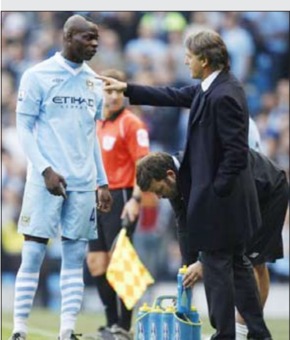
مانشيني مع لاعبه السابق بالوتيلي

حقق لوس انجيليس ليكرز فوزه الثالث على التوالي على ضيفه المتواضع نيو أورليانز هورنتس الـ 106-111 اول من أمس في دوري كرة السلة الأميركي للمحترفين، فعلى ملعب «ستايبلز سنتر» وإمام 18997 متفرجاً احتشدوا لمشاهدة فريقهم الذي يقدم احد اسوأ موسمه، تمكن ليكرز من تخطي عقبة ضيفه المتواضع نيو أورليانز، ليحقق بالتالي ثلاثة انتصارات متتالية للمرة الأولى منذ خمسة أسابيع. ورغم الانتصار الثالث على التوالي، مازال ليكرز بعيداً عن المركز الثامن الأخير المؤهل إلى البلاك أوف المنطقة الغربية، أن يتخلف بفارق 4 مباريات عن هيوستن روكتس صاحب هذا المركز وعلى ملعب «كويكين لونز أرينا» وإمام 13939 متفرجاً، تمكن غولدن ستايت ووريز، الفريق الاخر لولاية كاليفورنيا، من تخطي الغيابات في صفوفه والعودة مع مغل الجريج كيلفاند كافاليريون بفوزه الثامن والعشرين في 45 مباراة وجاء بنتيجة 108-95، معززا مركزه الخامس في المنطقة الغربية. وعلى ملعب «رون غارن» وإمام 18888 متفرجاً، عوض بورتلاند ترايل بلايزرز تخلفه امام ضيفه دالاس مافريكس بفارق 21 نقطة وخرج فائزاً 104-106 بفضل قاتلة سجلها في الثانية الاخيرة لاماركوس دريدج، مانحا فريقه فوزه الثالث والعشرين في 45 مباراة.