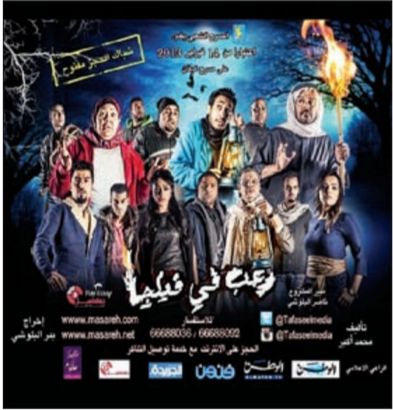
بوستر مسرحية «رعب في فيلجا»