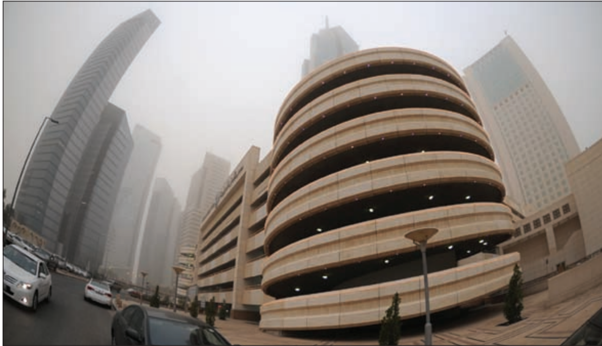
أجواء غائمة (هاني الشمري)

قال الفلكي خالد الجمعان ان فصل الشتاء في الكويت قد انتصف مع انتصاف الموسم الثاني منه (الشبظ) مؤكداً أن فصل الشتاء لم ينته و موسمه لاتزال مستمرة حتى نهاية الموسم الثالث والأخير منه (العقارب) وذلك وفق التقويم الفلكي لمنازل الشمس والقمر الذي يعتمد على مطالع النجوم في تحديد بداية ونهاية فتراته، وأضاف ان موسم الشبظ ينقسم الي فترتين (النعائم - البلدة) وهذه الايام تلعب بأيام (البلدة) نسبة إلى طالع نجم البلدة الذي يبدأ بعد نهاية فترة النعائم مباشرة، والبلدة هي موسم الشبظ وتعد من الفترات