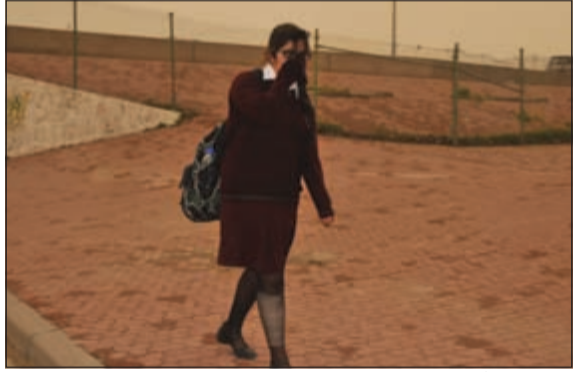
فتاة تغطي أنفها لحمايتها من الغبار (محمد خلوصي)