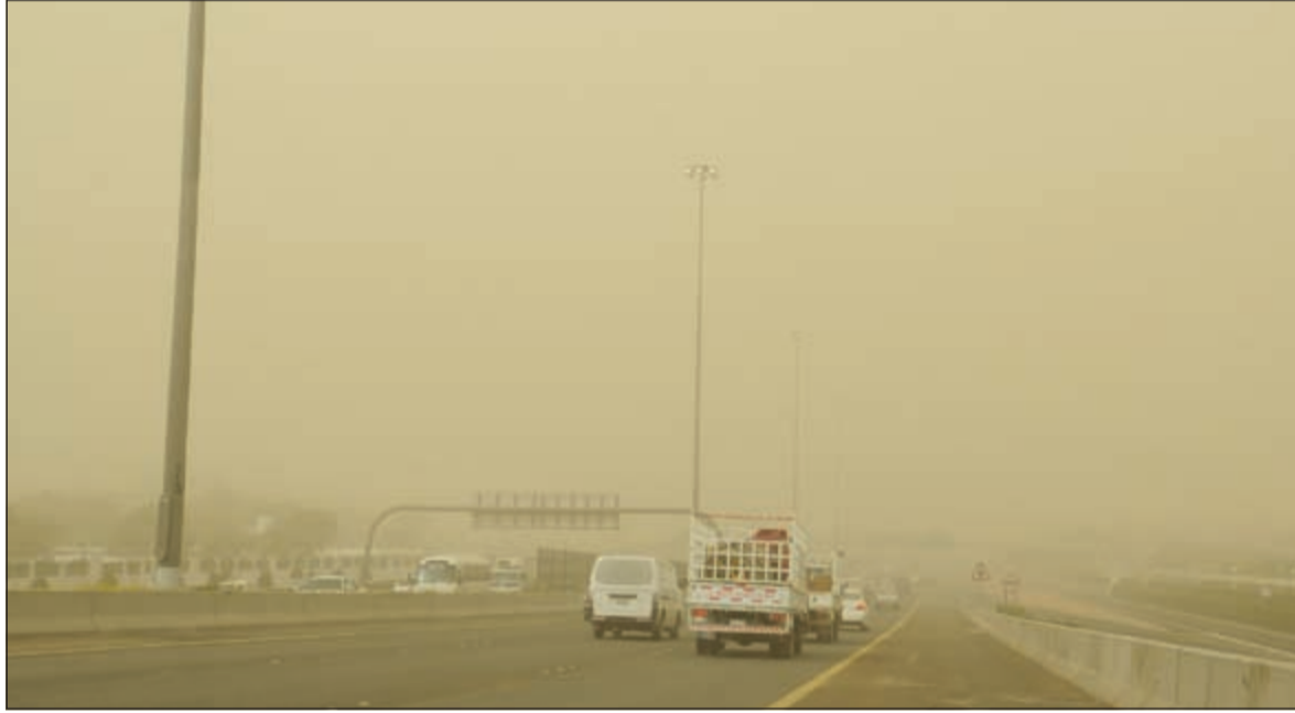
اتربة وغبار في الكويت امس

الإعلان بعد صدور الفتوى؟!، كذلك فإن مجلس القضاء ليست له سلطة مباشرة على وزير العدل خاصة إذا كان ذلك الطلب بمخالفة شرعية وكذلك دستورية، لأن المادة الثانية من الدستور تنص على أن دين الدولة الإسلام والشريعة الإسلامية مصدر رئيسي من مصادر التشريع، فعلى أي أساس يخالف هذه المادة بشكل سافر ومن دون ضرورة أو مبرر؟! كذلك القاعدة الشرعية تنص على أنه لا طاعة لمخلوق في معصية الخالق وهذا امتثال لهدي المصطفى ﷺ الذي قال «إنما الطاعة في المعروف»، فوزير العدل ليس ملزماً بذلك حتى لو اجبر على هذا الفعل بعد صدور فتوى التحريم، حيث أنه مطالب بالاصرار على رأيه أو تقديم استقالته طاعة لله ورسوله، وقد عرف عن الأخ الوزير أنه قبل سنوات قدم استقالته بعد ثلاثة شهور من توليه حقيبة الوزارة بسبب عدم المواءمة السياسية، لذلك يكون عدم المواءمة الشرعية أجدر وأولى يا معالي الوزير. لذا نطالب الأخ وزير العدل باتخاذ القرار المناسب لوقف طلبات وكيلات النيابة امتثالاً للفتوى الشرعية ولرأي جمهور الفقهاء ولا يكون ثمن استمراره في المنصب مخالفة الثوابت الشرعية والنصوص الصريحة التي منعت المرأة من تولي هذا المنصب. إن اعتراضنا على تولي المرأة القضاء ليس لأننا ضد المرأة، ولكن لأننا ملزمون بشرح الرحمن وهدي سيد الأنام اللذين منعا المرأة من تولي منصب القضاء.