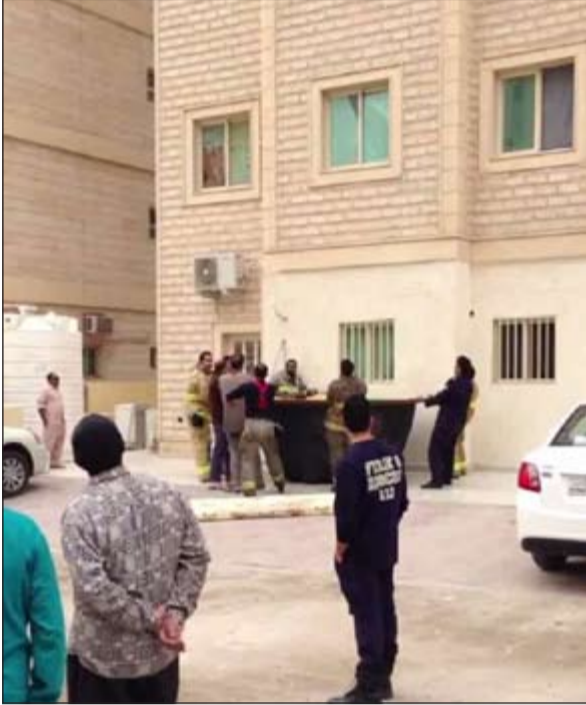
... ورجال الإطفاء يستعدون للتقاطه قبل ارتطامه بالأرض

رجال الإطفاء وضع حاجز واق للحيلولة دون اصطدامه بالأرض. هذا، ولم يوضع المصدر الأسباب التي دعت الوافد إلى الانتحار ومشيراً إلى أن حالة الوافد لم تسمح باستجوابه.