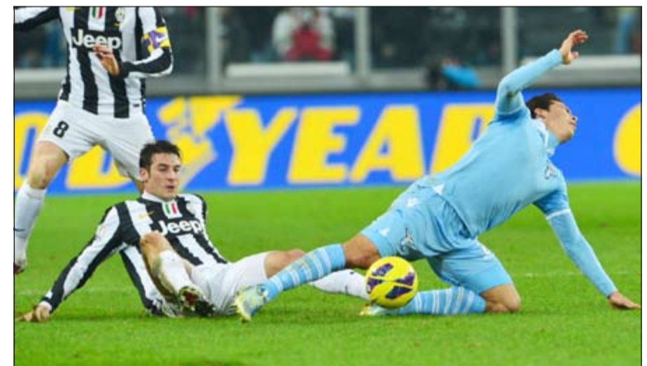
الصراع يتجدد بين يوفنتوس ولاتسيو في الكأس

مسابقة كأس إيطاليا اليوم وهما يسعيان لتعويض زلة المرحلة الاخيرة من الدوري المحلي. وسقط لاتسيو بشكل مفاجئ امام الفارق بينهما الى 3 نقاط بفوزه الثمين على مضيفه بارما 2-1. ورفع نابولي رصيده الى 46 نقطة مستغلا تعثر يوفنتوس المتصدر وحامل اللقب امام ضيفه جنوى 1-1 ليتقلص الفارق مع الفريق الجنوبي الى ثلاث نقاط فقط. وبقي باب التاهل الى نهائي الكأس مفتوحا في مواجهة دور الاربعة، لأن يوفنتوس اكتفى الثالث الماضي بالتعادل مع لاتسيو 1-1 على ملعب الاول «يوفنتوس ارينا»، كما فاز روما على انتر ميلان 2-1 في المباراة الثانية.