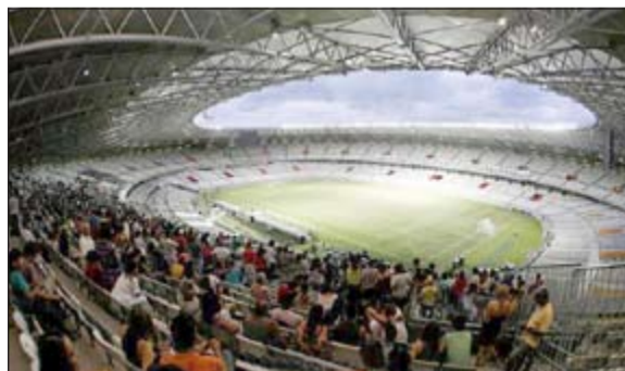
ستاد مينيراو أحد ملعبين فقط تم افتتاحهما

الكبرى، المونديال ليس لغزا»، على حد قول السياسي الذي وعد أن مونديال البرازيل «سببي بالتوقعات، بل ويتفوق عليها». رغم ذلك، تعد التأكيدات الرسمية كافية لإقناع البرازيليين. فالخروج السينمائي فيرناندو ميريليش على سبيل المثال اعترف بأنه «قلق» بتخفيف بلاده للحدثين الرياضيين الكبيرين، المونديال وبدوره الألعاب الأولمبية عام 2016 في ريو دي جانيرو. وقال مخرج فيلم «مدينة الرب» الشهير، في تصريحات لصحيفة «مترو» اللندنية «الرب فقط يعرف كيف سيقامان. على أن أقر أنني قلق للغاية. التخطيط ومواصلة