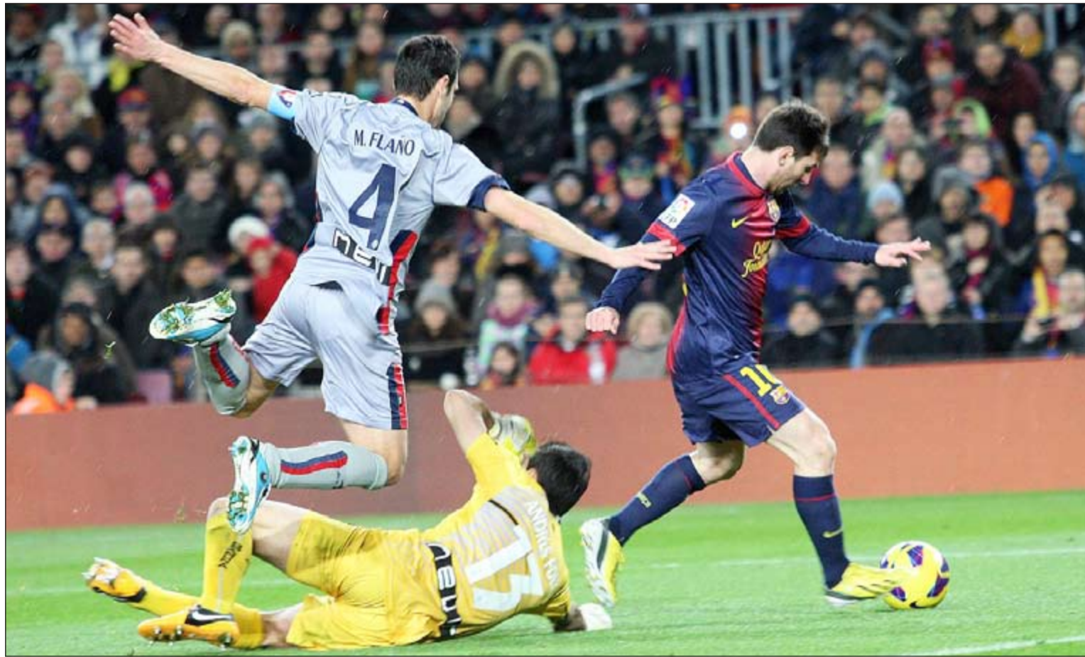
ميسي تائق وأبدع وسجل «سوبر هاتريك» في مرمى اوساسونا

استعاد برشلونة توازنه بفوز ساحق على ضيفه اوساسونا 5-1 كان نصيب نجمه الأرجنتيني ليونيل ميسي منها «سوبر هاتريك» على ملعب كامب نو في المرحلة الحادية والعشرين من الدوري الإسباني لكرة القدم.