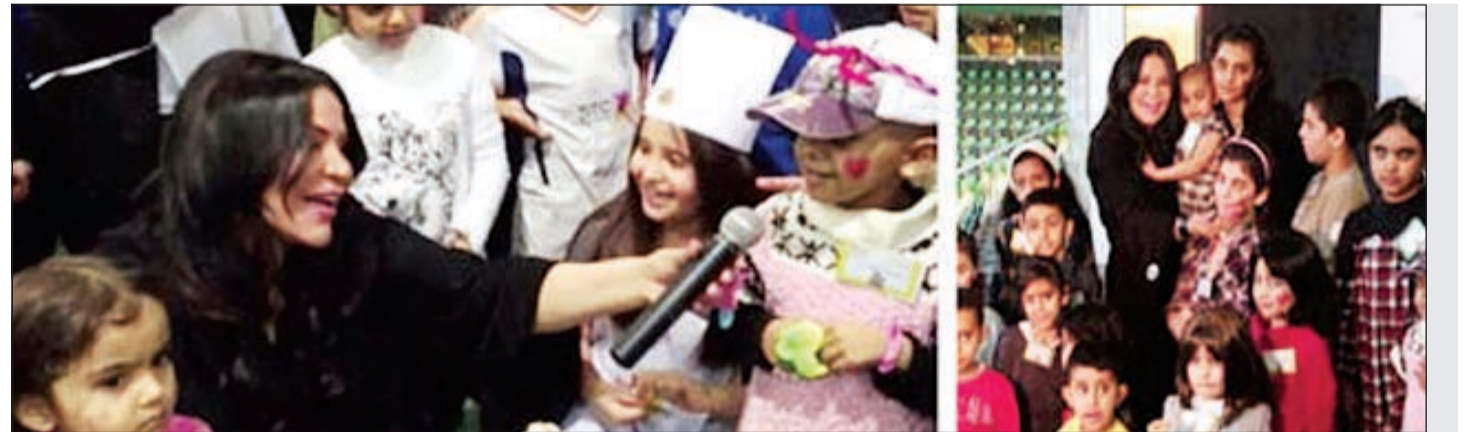
أحلام مع أطفال مرضى السرطان وجمعية قرية سند

انقذت العناية الإلهية النجمة العراقية مريم حسين من الموت بعد تعرضها لحادث سير أسفر عن تضرر سيارتها بشكل كبير. الحادث، بدأ بملاحقة بعض المعجبين للفنانة الشابة بسيارتهم فور مشاهدتهم لها داخل سيارتها، لرغبتهم في التصوير معها، ولما حاولت مريم الابتعاد عنهم لاحقوها بشكل