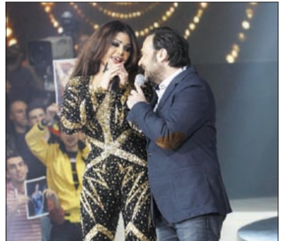
هيفاء وهي تغني مع أحد المشاركين