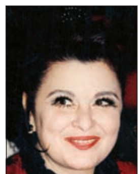
الفنانة الراحلة سعاد حسني

يبحث المنتج المصري ممدوح شاهين بشكل مكثف حاليا عن فنانة تجسد دور الراحلة سعاد حسني، في أحدث مسلسله الجديد «الزوجة الثانية» الذي من المقرر عرضه قسي رمضان المقبل.