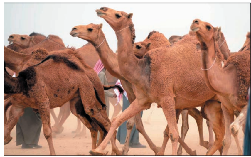
جانب من الإبل الحمر داخل ميدان المسابقة