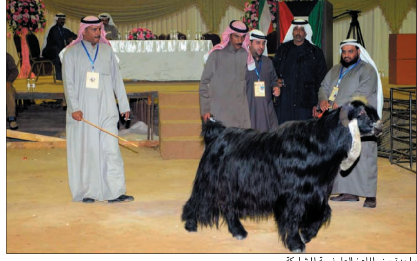
واحدة من الماعز العارضية المشاركة