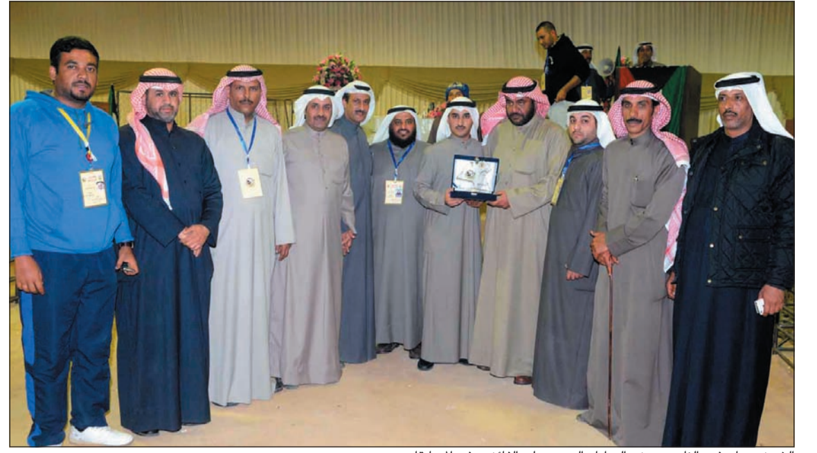
الشيخ صباح فهد الناصر يوزع الهدايا والدروع على الفائزين في المسابقات

أكدت مصادر بوزارة الأشغال أن افتتاح جسر الغزالي تم بناء على تعليمات وأوامر من وزير الأشغال وذلك مراعاة مصالح الجهات الحكومية الأخرى التي تضررت جراء إغلاقه، وكذلك طلبية الجامعات، مؤكدة أن عملية فتح الجسر ستكون مؤقتة لحين إيجاد حل بديل. وأضافت المصادر أن افتتاح جسر الغزالي سيجعل وزارة الأشغال تواجه عوائق كثيرة حيال تنفيذ طريق الجهراء لأن هذا الجسر مرتبط ارتباطاً كلياً بطريق الجهراء حيث أن مشروع الجهراء يتكون من 5 مراحل أربع مراحل منها لا تسبب أي مشكلة، فيما الخامسة هي ذات الصلة بمشروع طريق الجهراء. وأشار إلى أن عمل وزارة الأشغال في جسر الغزالي هو عمل هو قص حوالي 350 متراً من أجل استخراج قواعد الجسر الجديد الواقعة تحت جسر الغزالي وعليه سيتم إزالة الجسر وإعادةه من جديد