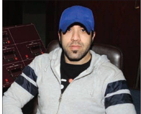
المخرج فراس آل بن علي