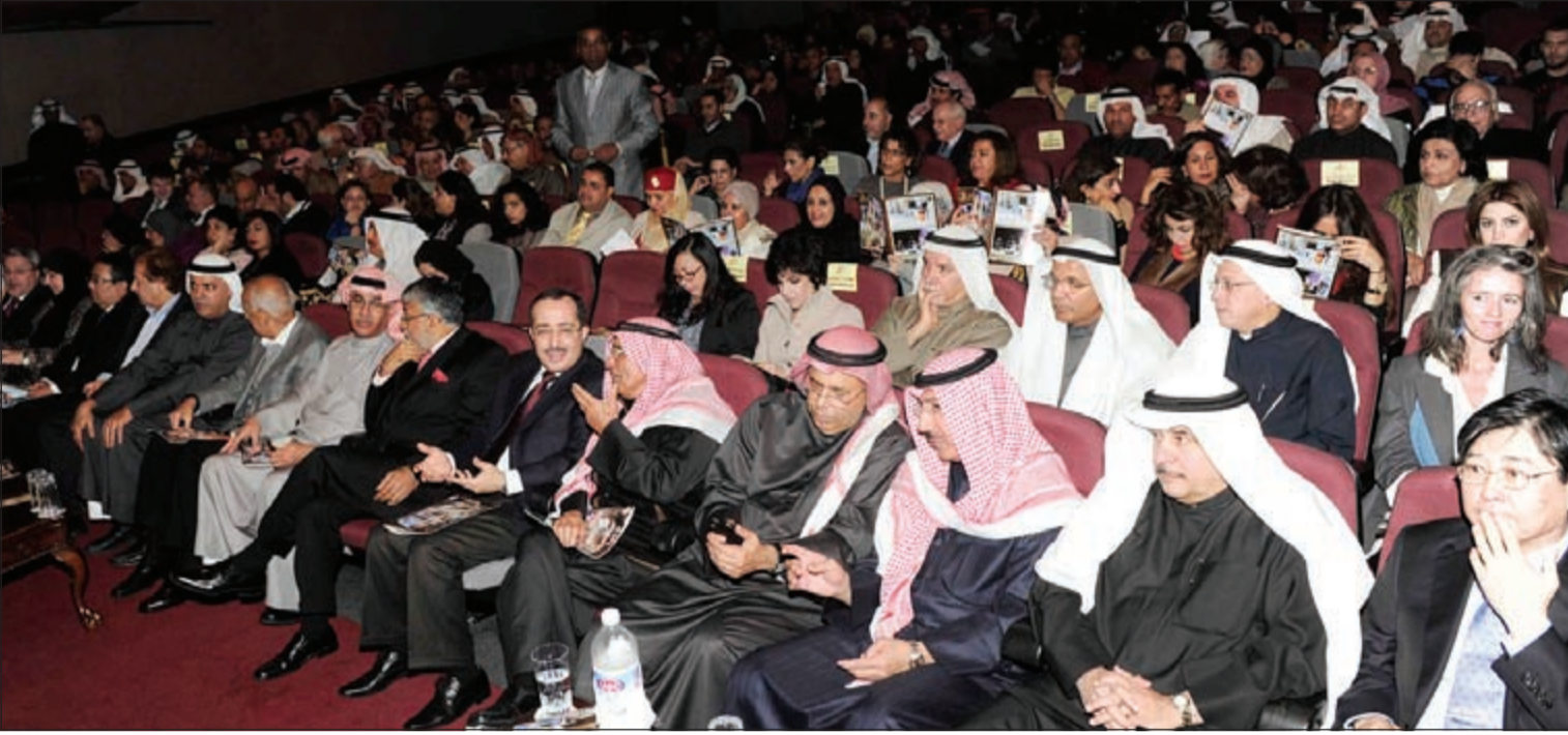
جانب من الحضور الكبير في مسرح الدسمة