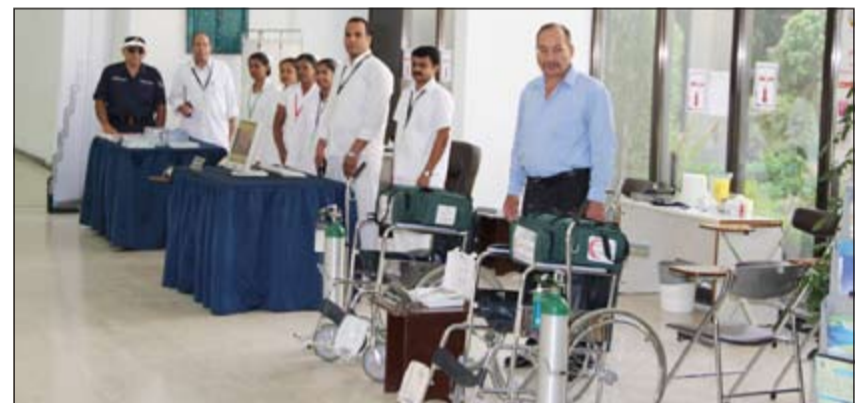
إحدى العيادات الطبية الموجودة في مواقع الجامعة

مثل تحليل السكر وقياس الضغط وعمل جسيمة أكسجين وقياس الوزن وقياس درجة الحرارة.