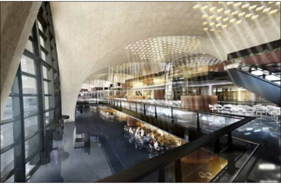
أحد مخططات مبنى الركاب «2» الجديد

يتراوح ما بين 30 و 50 بوابة كما يشمل المشروع فندقاً لاستقبال مسافري الترانزيت وقاعة استراحة لركاب الدرجة الأولى ودرجة رجال الأعمال بالإضافة الى مواقف سيارات متعددة الأتوار تتسع لحوالي 4500 سيارة لخدمة المغادرين والقادمين.