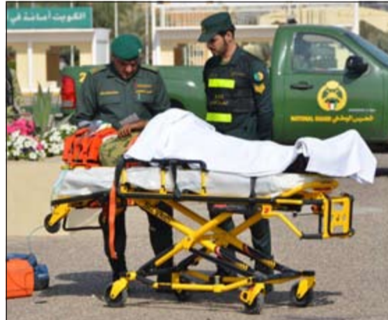
عناصر الحرس تتولى إنقاذ المصابين في موقع الحادث