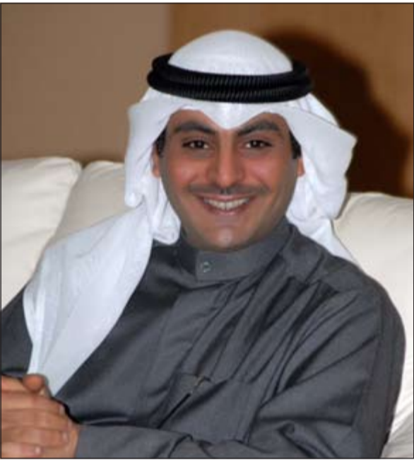
الشيخ أحمد مشعل الأحمد

وأكد الشيخ أحمد مشعل الاحمد حرص الجهاز على متابعة تنفيذ المشاريع الكبرى والتنسيق بين الجهات الحكومية لإنجاز هذه المشاريع وتذليل المعوقات ومعالجة المشكلات التي تعترض تنفيذها، مشيراً الى ان توجيهات سمو رئيس مجلس الوزراء.