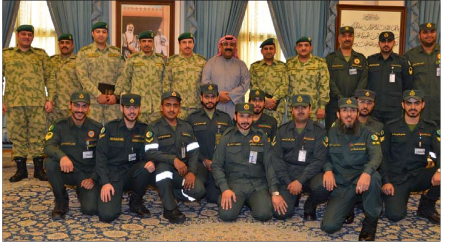
الشيخ مشعل الأحمد مستقبلاً منتسبي مديرية الخدمات الطبية