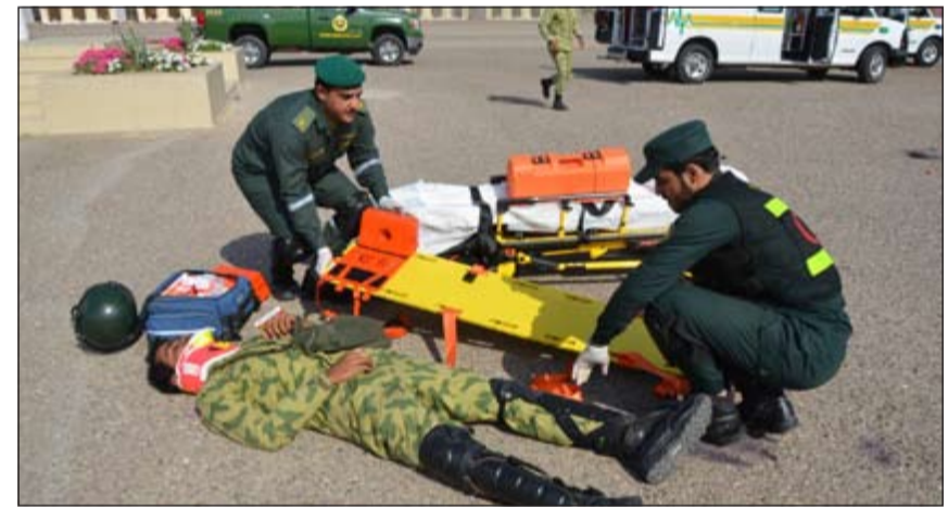
سرعة في التعامل مع المصابين لإنقاذ حياتهم