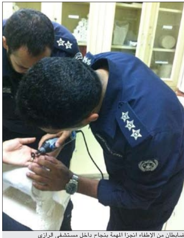
ضابطان من الإطفاء انجزا المهمة بنجاح داخل مستشفى الرازي

تقدم شاب يبلغ من العمر 23 عاماً واتهم شابين بابتزازه والنصب والاحتيال، وقال مصدر أمني أن الشاب قال في بلاغته في مخفر الجليب أنه تواصل مع فتاة (هكذا كان يفترض) وارتبط معها بعلاقة غرامية ووصل الأمر