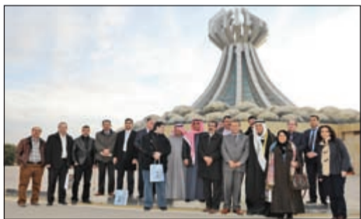
الوفد الصحافي الكويتي مع السفير علي المؤمن أمام النصب التذكاري لضحايا مدينة حلبجة

«كردستان» ينفذ آثار جرائم صدام ويخطو بثبات نحو التقدم 28