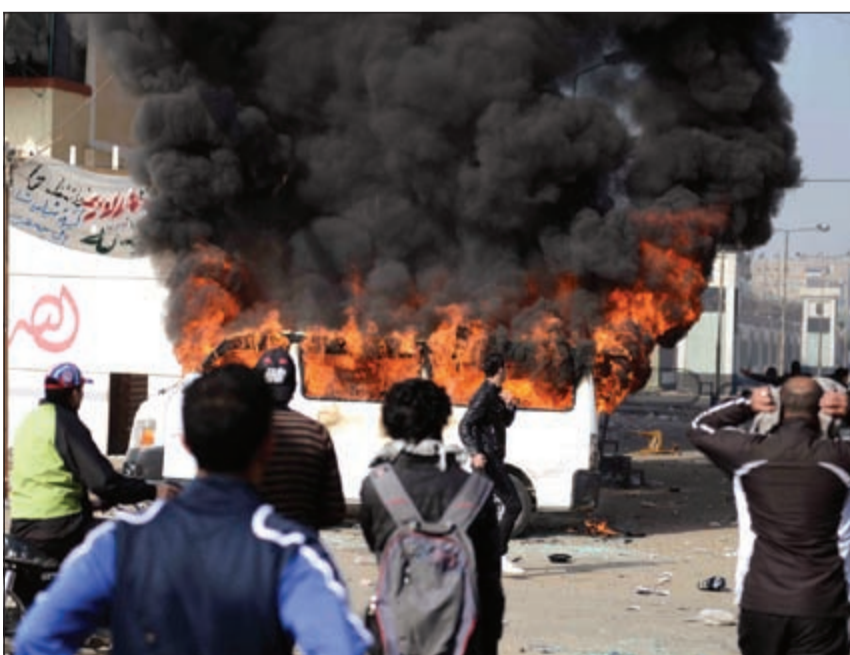
مجموعة من الأهالي الغاضبين يحرقون عربة تلفزيونية بالقرب من سجن بورسعيد عقب الحكم أمس

واقالة النائب العام واخضاع جماعة الإخوان المعارضة للقانون. وقالت الجبهة في بيان انه ما لم يتم الاستجابة لمطالبها الأربعة «خلال الايام القليلة القادمة» فإنها