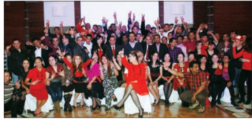
لقطة تذكارية لموظفي فندق وريجنسي سفير الفنتاس أثناء الحفل

استمتع بها الحضور ويث روح الحماس بين الحضور مثل عروض المواهب، منافسة الكاريوكي وسحب الجوائز والعديد من الألعاب وبرنامج ترفيهي للأطفال، بالإضافة إلى تكريم عدد من الموظفين المتميزين، وقد جاء الاحتفال تنويجا لإنجازات المديرين والموظفين على مستوى