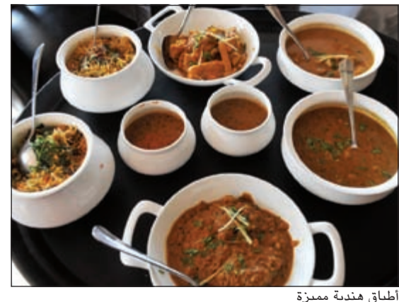
أطباق هندية مميزة