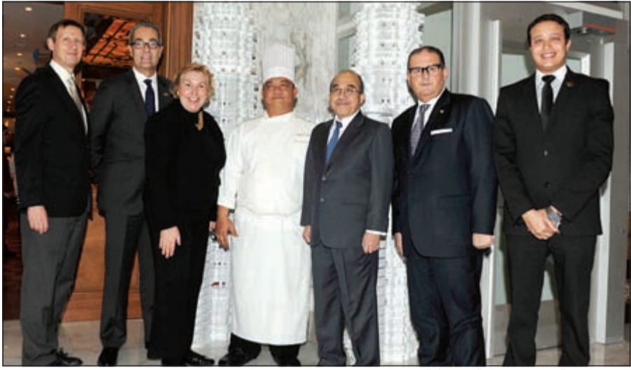
فريق عمل «الريجنسي» مع السفير الماليزي

كعادة فندق الريجنسي في السعي لتقديم أقصى حدود التميز والمذاق الأفضل لرواده، فقد أقام الفندق ليلة خاصة للمأكولات الماليزية المذهلة دعا فيها عددا من سفراء دول آسيا ولغيف من الإعلاميين كجزء من مهرجان المأكولات الماليزية المستمر في مطعم طريق الحرير حتى نهاية الشهر الجاري، والذي يسلط فيه الفندق الضوء على أفضل فنون الطهي الماليزي المهيبر والتشكيلية الرائعة من المأكولات الماليزية ذات المذاق الخاص.