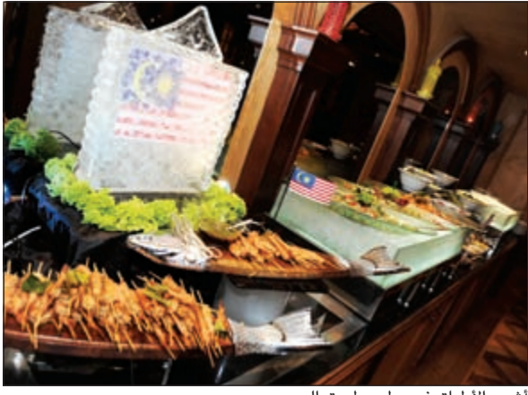
أشهر الأطباق في مطعم طريق الحرير