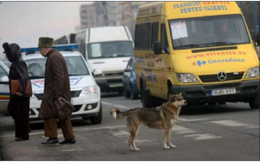
كلب ضال في انتظار إشارة المرور

في العام الماضي وحده عن مصرع 360 شخصا واصابة أكثر من 1200 آخرين نتيجة لعدم الالتزام بقواعد المرور. وأشارت الشبكة الى ان كاميرات التلفزيون الرومانية نشرت لقطات لكلاب ضالة وهي تعبر من جانب لآخر من الاماكن المخصصة لعبور المشاة وتتوقف ايضا عند ظهور الضوء الاحمر. وكانت المحكمة العليا في رومانيا قد رفضت مشروع قانون يدعو لقتل الكلاب الضالة والتي يبلغ عددها نحو 40 ألفا في العاصمة الرومانية بوخارست وحدها.