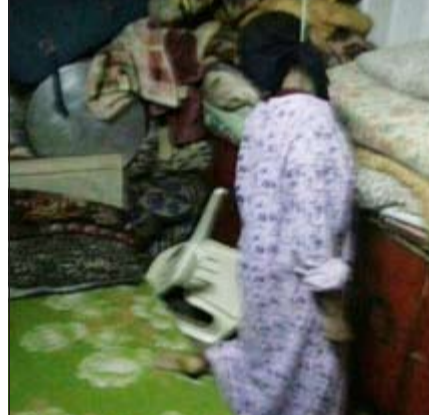
الآسيوية بعد انتحارها

احيلت جثة وافدة آسيوية الى الطب الشرعي وسجلت مبدئيا قضية انتحار. وكان مواطن ابلغ عمليات الداخلية ان خادمتها الآسيوية اقدمت على الانتحار داخل غرفتها، وفور تلقي عمليات الداخلية سارع مدير امن الجهراء الى المنزل الذي شهد واقعة انتحار الآسيوية والكائن في منطقة تيماء، وتبين من معاينة مكان الانتحار ان الآسيوية قامت بربط رقبته بحبل ووضعته قديمها على كرسي قبل ان تزيع الكرسي بقدميها لتلقى مصرعها شنقا. ● هاني الظفيري - محمد الدشيش