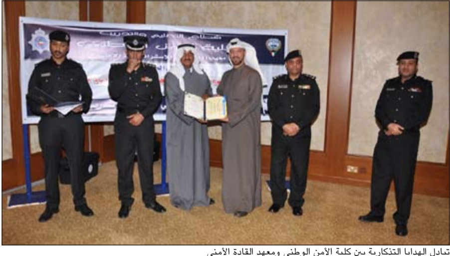
تبادل الهدايا التذكارية بين كلية الأمن الوطني ومعهد القادة الأمني

برعاية وكيل وزارة الداخلية المساعد لشؤون التعليم والتدريب الفريق أحمد النواف وبحضور مساعد مدير عام كلية الأمن الوطني العميد فوزي يوسف السويلم ومدير معهد الدراسات الاستراتيجية الأمنية العقيد حزام عبدالرحمن الرشيد، اختتم معهد الدراسات الاستراتيجية الأمنية بكلية الأمن الوطني حلقة نقاشية للقيادات العليا نظمت بالتعاون مع معهد القادة الأمني للدراسات والتدريب الأهلي والذي يترأسه الفريق متقاعد الفريق متقاعد مساعد الغوينم بعنوان «الرقابة والتفتيش وقياس الكفاءة الأمنية»، والتي عقدت مؤخرا، وشاركت فيها قيادات من وزارة الداخلية والحرس الوطني. وأدار الحلقة النقاشية كل من مدير عام كلية الأمن الوطني اللواء ركن محمد رافع الديحاني واحمد خيرى الشيوبي مدرب متخصص بكلية الأمن الوطني، وتناول النقاش في الحلقة تنظيمات الرقابة والتفتيش بوزارة الداخلية وعلاقتها بوظائف الإدارة وأسلوب قياس الكفاءة الأمنية. من جهته قال الفريق الغوينم ان المحاور التي تم تناولها تضمنت تنظيمات الرقابة والتفتيش في وزارة الداخلية وعلاقة الرقابة والتفتيش بوظائف الإدارة وتخطيط التنظيم وتنظيمه. وقال الغوينم ان الدورة شارك فيها عدد من الضباط من ذوي الرتب العليا مؤكدا ان النقاش صب في كل ما من شأنه مصلحة القيادات العليا. وفي ختام الدورة قام الفريق متقاعد الغوينم وبمشاركة اللواء ركن محمد رافع بتوزيع الشهادات والهدايا التذكارية على الحضور. ● محمد الجلاهمة