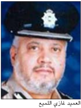
العميد غازي الميمع

احال رجال الإدارة العامة لمباحث الهجرة مواطننا صادر بحقه بالسجن لمدة 3 أشهر السى النيابة العامة بتهمة التزوير في محررات رسمية والاتجار في الإقامات، وقال مصدر امني ان معلومات وصلت الى مدير عام الإدارة العامة للهجرة العميد غازي الميمع عن ان مواطننا اعتاد جلب عمالة منزلية على كفالته ووصلت «الغيزا» التي صدرت له من قبل ادارات الهجرة ومراكز الخمة 21 اقامة لعمالة منزلية. وقال المصدر: تم استدعاء الشخص الذي جلب هذا الكم من العمالة المنزلية الوافدة حيث نفى علمه بأنه جلب ايا من هذه العمالة، مؤكدا أنه غير متزوج ولا يسمح له بجلب اي عمالة منزلية. واضاف المصدر: تم عمل مزيد من التحريات التي خلصت الى ان شقيق المواطن هو الذي جلب على اسمه هذا الكم من العمالة الوافدة و فعل ذلك بطرق ملتوية وعليه تم القبض عليه وبالإستعلاء عن سجله تبين انه صادر بحقه حكم بالحبس 3 أشهر وصار بحقه 8 أوامر ضبط واحضار منع سفر على ذمة قضايا مختلفة. وبالتحقيق معه قال انه زور عقد زواج لشقيقه ومن ثم كان يتسرد على مراكز الخدمة وادارات الهجرة لاستخراج سمات دخول لعمالة منزلية وبعد ان يستخرج الاذن يقوم بتسليمه الى اقارب وافدين آسيويين يرغبون