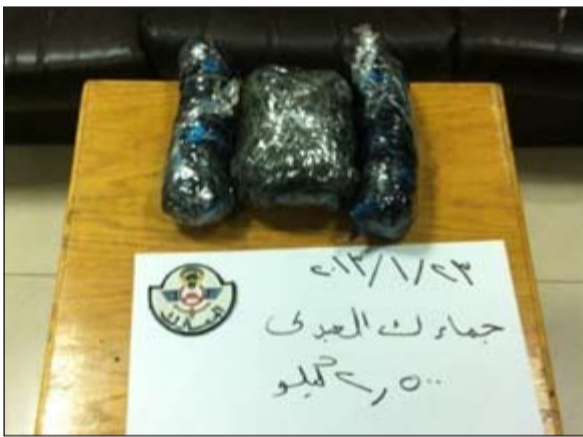
النشبو المضبوط في العبدلي