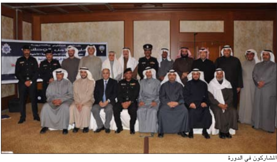
المشاركين في الدورة