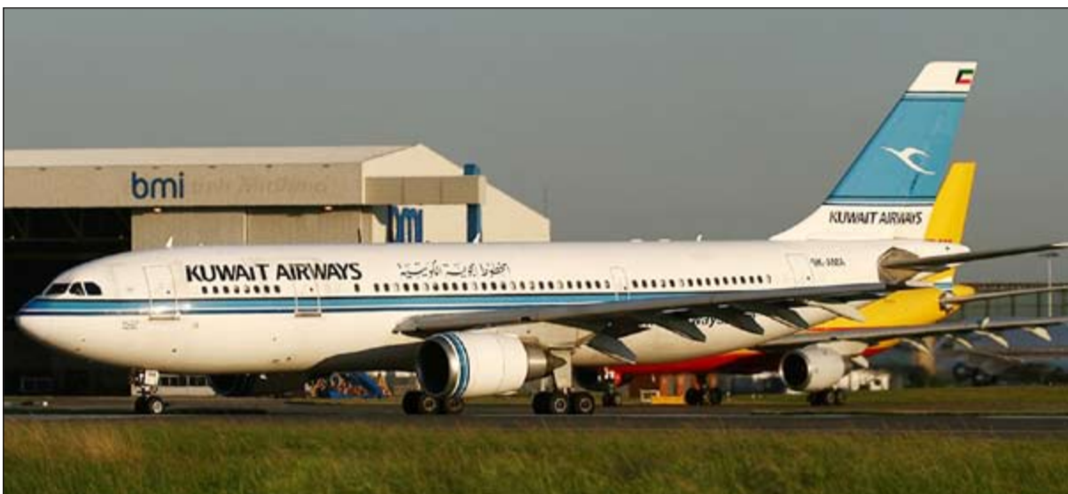
التأجير أو الشراء مرتبط بالتمويل وكل الخيارات مفتوحة أمام الشركة

على طائرات كثيرة والحصول ايضا على شروط من المصانع أكثر وان الامر غير ذلك ان سيوفرها المرسوم وان كان هذا المبلغ تعتقد الشركة انه من الأفضل له ان يتحول الى اصول وأفضل الاصول لشركة طيران هي الطائرات. وقال ان قضية تحديد الجهة التي ستشتري منها «الكويتية» لم تحدد حتى الآن، ولكن في حينها ستري الشركة ما هو الأفضل وانها تقف على التمويل وستتظر الشركة الى ما هو موجود بالسوق وما هو جيد وكل شيء في حينه، مضيفاً ان الوضع الاقتصادي للشركة سيئ ويعلم به الجميع من ديون متراكمة وحساب مكشوف وهذه الامور لم تكن لتؤهل الشركة الى تفاوض بشكل جدي مع شركات تعرض طائرات للبيع، مبيناً انه الفترة السابقة كانت الشركة تستقبل عروض ولكنها لم