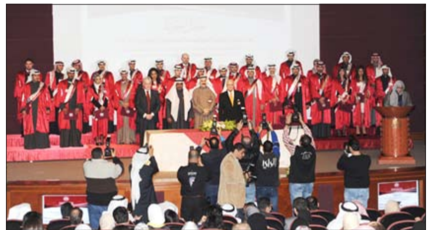
لقطة جماعية للمتدربين والمتدربات

وأشار الرفاعي إلى الجهود الحثيثة التي قام بها المعهد من خلال الارتباط بالمؤسسات والمنظمات الإقليمية والدولية، حيث حصل مؤخرا على اعتماد العديد من المؤسسات المتميزة عالميا، وأصبح مركزا معتمدا للاختبارات الدولية، ومركزا للتدريب على اختبارات الشهادات الدولية، من قبل بعض الجهات مثل: منظمة التدريب الأوروبية للخدمات المصرفية والمالية، جامعة كمبودج بالملكة المتحدة، بالإضافة إلى معاهد اعتماد الشهادات المتخصصة مثل: المعهد البريطاني المعتمد للتسويق، المعهد العالمي لشهادات الموارد البشرية المعتمد بالولايات المتحدة الأمريكية، المعهد المعتمد بالولايات المتحدة الأمريكية.