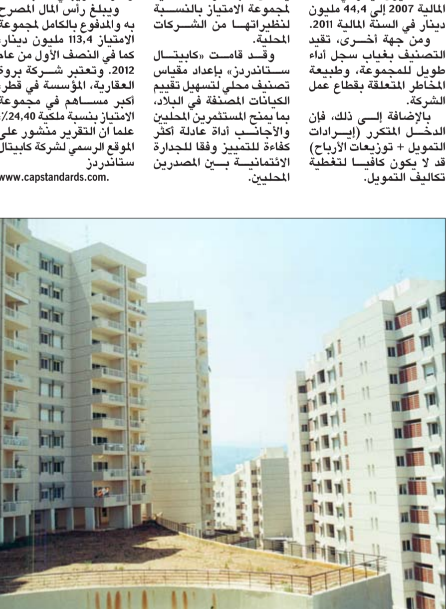
بيروت - اتحاد درويش

وأوضح التقرير انه وبنهاية تداول الاسبوع الماضي بلغت القيمة السوقية الرأسمالية للشركات المدرجة في السوق الرسمي 29,911,3 مليون دينار بارتفاع قدره 184,5 مليون دينار وما نسبته 0,6٪ مقارنة