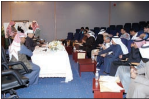
جانب من إجراء القرعة

أجرت اللجنة الرياضية العليا المنظمة لدوري الوزارات والمؤسسات الحكومية قرعة البطولة للموسم الحالي، والذي سينطلق مطلع مارس المقبل بمشاركة 18 وزارة وهيئة ومؤسسة حكومية، وقد تم تقسيم الفرق المشاركة إلى أربع مجموعات، حيث وضعت على رأس كل مجموعة الفرق الأربعة الأولى للموسم الماضي وهي الأوقاف والدفاع والمالية والإعلام.