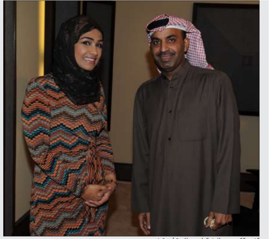
النجم الكوميدي طارق العلي مع الممثلة أميرة نجم