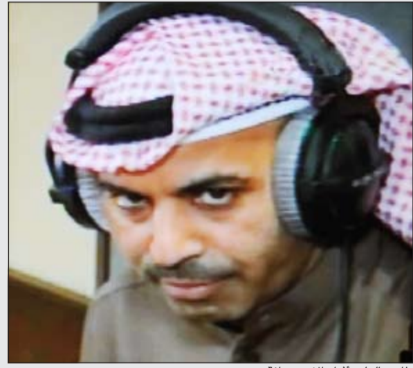
طارق العلي أثناء الاستضافة

عنده شي يقوله بخصوص مسرحياته، مشيراً إلى أن كلمة «تافهة» لا يفضلها أن تقال على أعماله أو في أي عمل مسرحي آخر لأن هناك جهداً يبذل من قبل فرق عملها لإيصال الفكرة من هذا العمل.