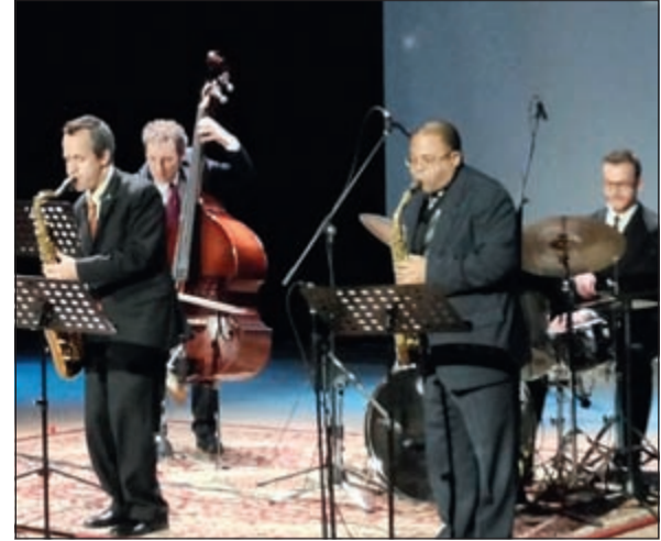
جانب من فقرات الفرقة