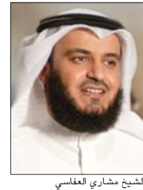
الشيخ مشاري العفاسي

قال بنك بوبيان إن أنشودة «محمد» التي قام برعايتها إنتاجها بالتعاون مع الشيخ مشاري العفاسي لا تزال تحقق مشاهدات عالية على الإنترنت، حيث بلغ عدد متابعيها حتى الآن حوالي ربع مليون مشاهد، مسيراً إلى أنها تعتبر بمنزلة رسالة إلى الأمة الإسلامية بضرورة الاقتداء بخير البشر الذي تحل ذكرى مولده على العالم هذه الأيام.