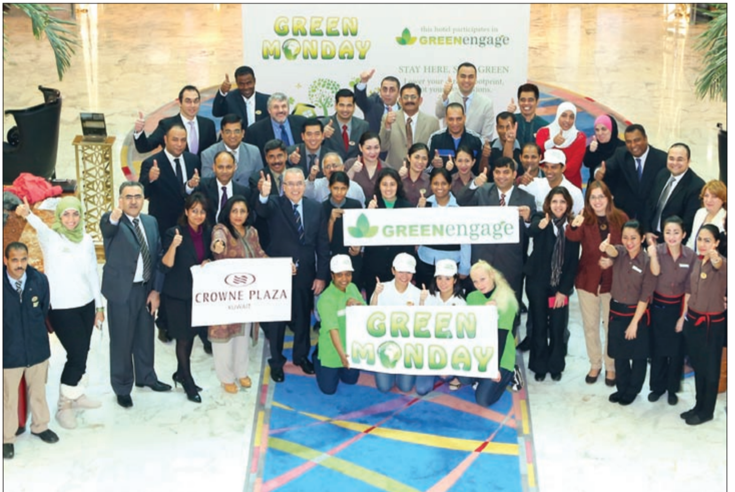
لقطة تذكارية لإداريي وفريق كراون بلازا في يوم الاثنين الأخضر

التزامنا والتعاون لايتحار طرق جديدة للمحافظة على البيئة. فنحن دائماً نبحث عن أساليب جديدة للحد من انبعاثات الفندق لغاز الكربون كما ننظر في كل جانب من جوانب دورة العمل في الفندق لاختيار الإضاءة الصحية واختيار مواد التنظيف المناسبة وتوفير تدريب للموظفين لضمان المحافظة على البيئة. وتعتبر مجموعة فنادق انتركونتيننتال أول مجموعة فنادق توائم برنامج LEED للمحافظة على البيئة والاشتراف في برنامج Green Engage. وكل هذا حرصاً من المجموعة على المحافظة على البيئة وإرضاء ضيوفها المهتمين بالبيئة.