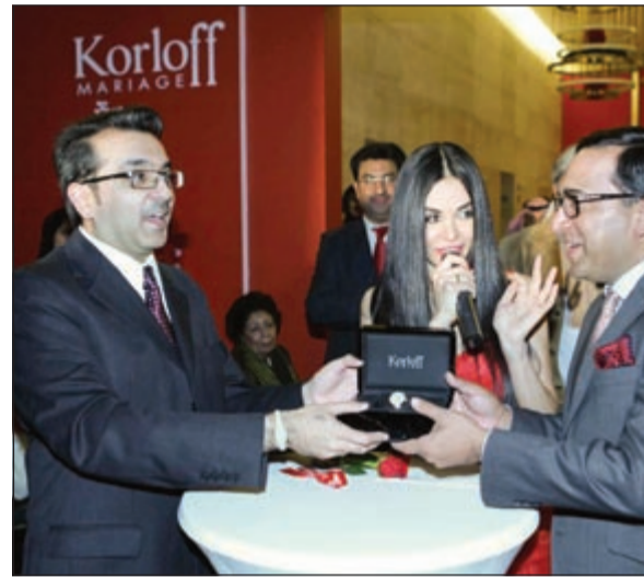
جانب من العرض

من الإكسسوارات. وكورلوف مارياج هي عبارة عن مفهوم مستوحى من الشرق الأوسط، حيث حفلات الزفاف الفخمة تعتبر جزءاً أساسياً من ثقافة المنطقة. وقد تم تطوير