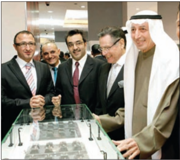
جولة للاطلاع على المعروضات

في العام 1935 قام الراحل مراد يوسف بهبهاني بتأسيس مجموعة بهبهاني لتصبح اليوم، وبعد أكثر من 75 عاماً من النجاح واحدة من كبريات الشركات التجارية في قطاع التجزئة، الجملة، والسيارات والهندسة والسفرات. وتعتبر مجموعة بهبهاني من الشركات التي لها بصمة بارزة في تاريخ الكويت، حيث كانت أول من أدخل البث الإذاعي للكويت في العام 1948 وبعده البث التلفزيوني في العام 1951. ويعتبر السيد بهبهاني أول من أدخل المكيف إلى الكويت في العام 1949. فإن مجموعة بهبهاني تدير مجموعة متنوعة من الأنشطة التجارية والاقتصادية التي تمثل باقة من أشهر العلامات والأسماء التجارية وخاصة في قطاع المنتجات والسلع الفاخرة كالساعات، وتمتلك الشركة شبكة واسعة ومتنامية من البوتيكات الراقية للساعات والمجوهرات في مناطق عديدة داخل الكويت لتكون المحطة الأرقى والاختيار الأمثل للرجال والنساء الباحثين عن الفخامة والأناقعة.