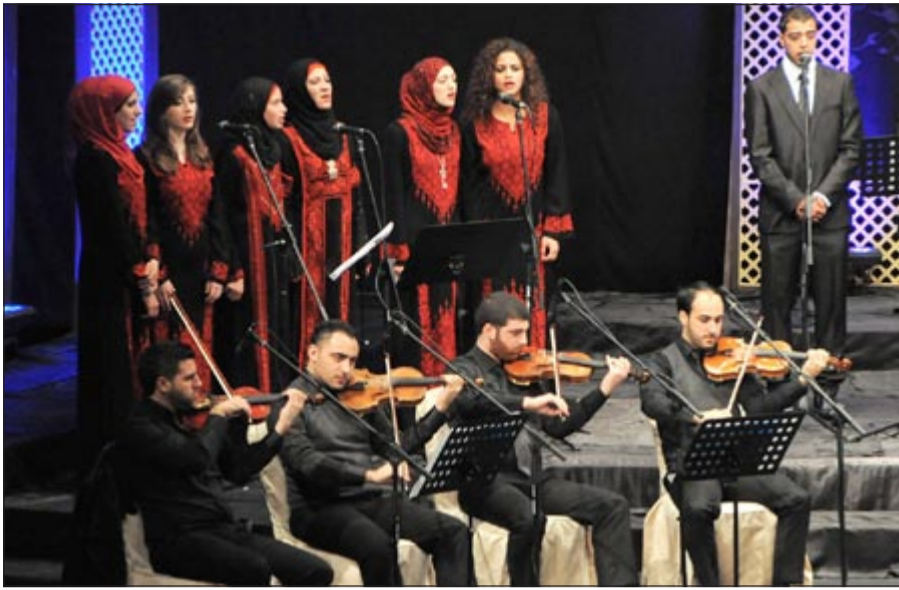
جانب من فقرات الحفل