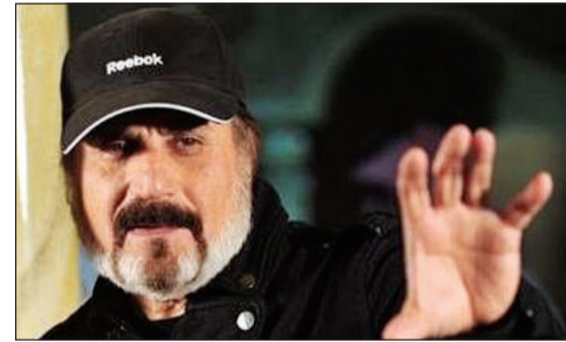
المخرج عبدالخالق الغانم

كشف المخرج السعودي عبدالخالق الغانم أنه لا يخشى مما يتردد في كواليس الوسط الفني والإعلامي من أن نجومية الفنانين الكبيرين حياة الفهد وسعاد عبدالله ستطغى على المسلسل الذي سيجمعهما بعد غياب فني بينهما امتد ما يقارب عشرين عاماً تحت إدارته الإخراجية بعنوان «مساكم من عواده» وسيتم عرضه خلال شهر رمضان المقبل، مشدداً، بحسب «سيدتي نت»، على أنه وحياة وسعاد فنانون كبار وليسوا مراهقين فنيا حتى يحاول أي منهم فرض رأيه على العمل، وقال: رغم أنني لم أتعامل فنياً في السابق مع نجمتي الخليج،