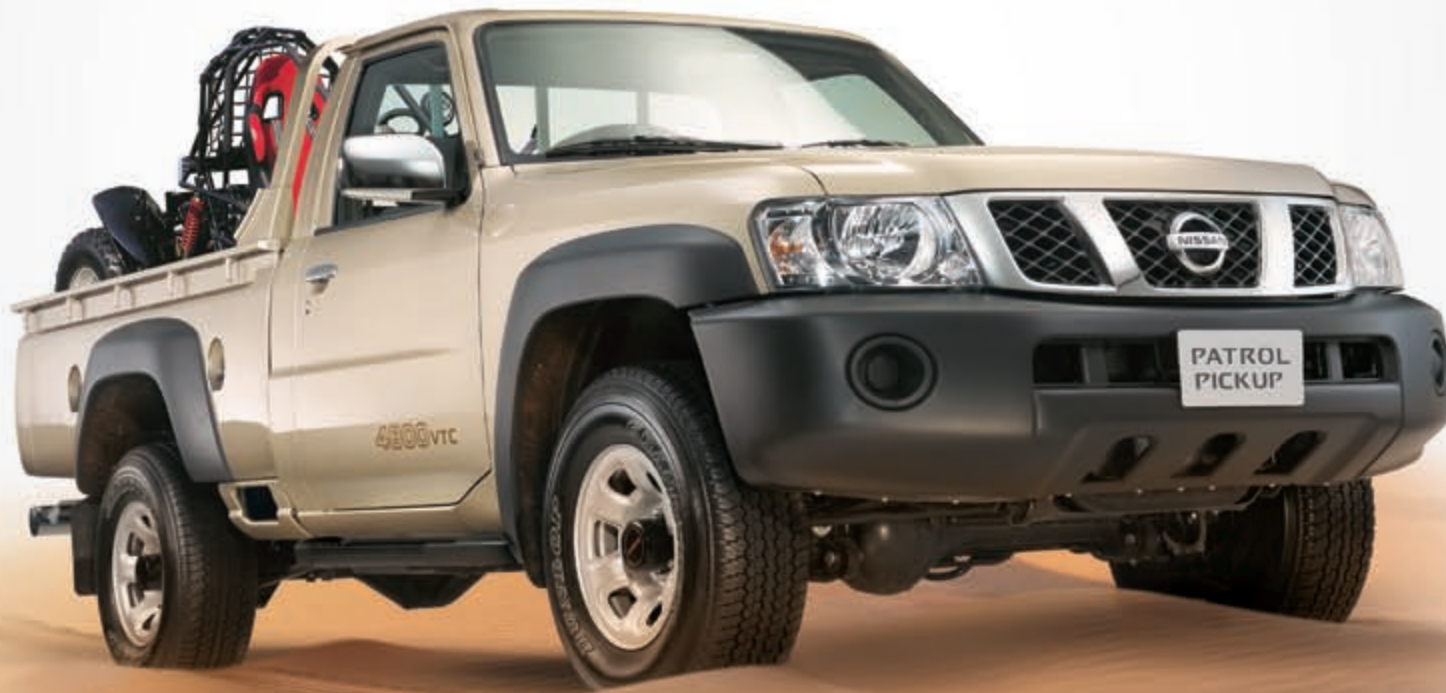
محرك بنزين 4800 سي سي، 6 سلندر بقوة 280 حصان للجهاز بنظام التحكم بتوقيت الصمام VTC.