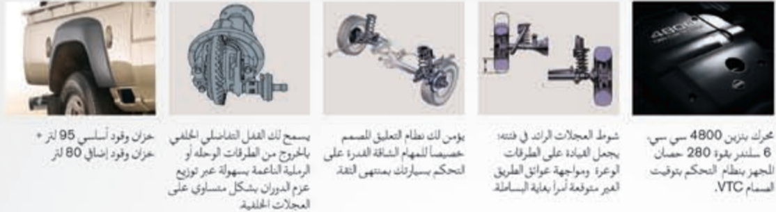
حزان وفود أسبسي 95 لتر * حزان وفود إسبالي 80 لتر