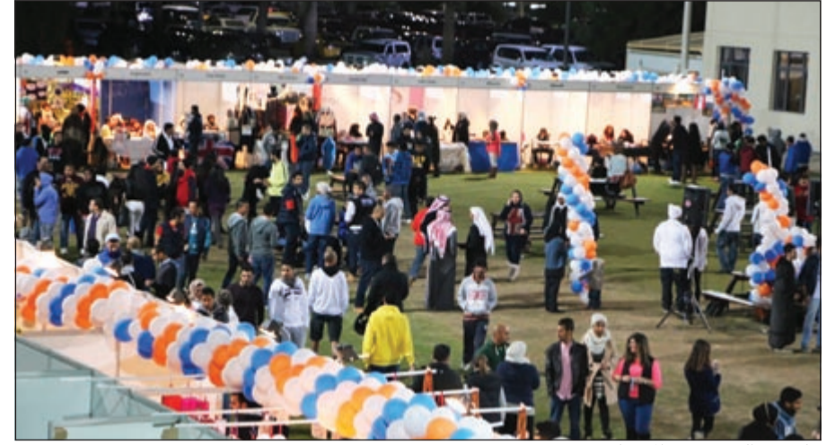
جانب من الحضور في المهرجان

إبداعية جديدة لغفت إليها انتباه الزوار. وعلى مدى 3 أيام في مدة إقامة البازار توافد نحو 2000 زائر وضيوف على الأجنحة المختلفة للبازار والتي ضمت قطاعات عديدة ومتنوعة من المنتجات التي حملت علامات تجارية مختلفة شملت الغذاء والإكسسوارات والملابس والمشروبات.