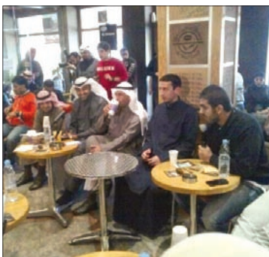
الشيخ محمد العبدالله ود. نايف الحجرف مع المفردين

فوائد القروض مازال يدرس من قبل وزارة المالية، على الرغم مما أعلنه وزير المالية مصطفى الشمالي أن صندوق المعسرين هو الحل. وأشار العبدالله إلى أن البنك الدولي طلب من الحكومة وضع تشريع لسرية تداول المعلومات لأنها وجدت أن المعلومة متاحة للجميع. وأضاف أنه غير صحيح تخصيص مبلغ 250 مليون دولار لمراقبة «تويتر» والمواقع الإلكترونية، مشددا على أن الكويت الدولة الوحيدة التي لم تشجع قانونا يمنع تداول المعلومة. من جهته، قال الوزير مرت الحجرف إن الكويت مرت بظرف استثنائي وتحتاج إلى حلول استثنائية من الأطراف كافة وليس من طرف واحد، مشيرا إلى ان الجميع أصبح سياسيا فتحكمت السياسة في جميع المجالات كالرياضة والفن وغيرهما. هذا وقال المصدر الوزاري ان الحكومة ستستحيل الى المجلس تقارير بقضايا الاعتداء على المال العام استجابة لطلب المجلس وسيتم ذلك مرتين سنويا وبيدانا اجراءات تنفيذ ذلك.