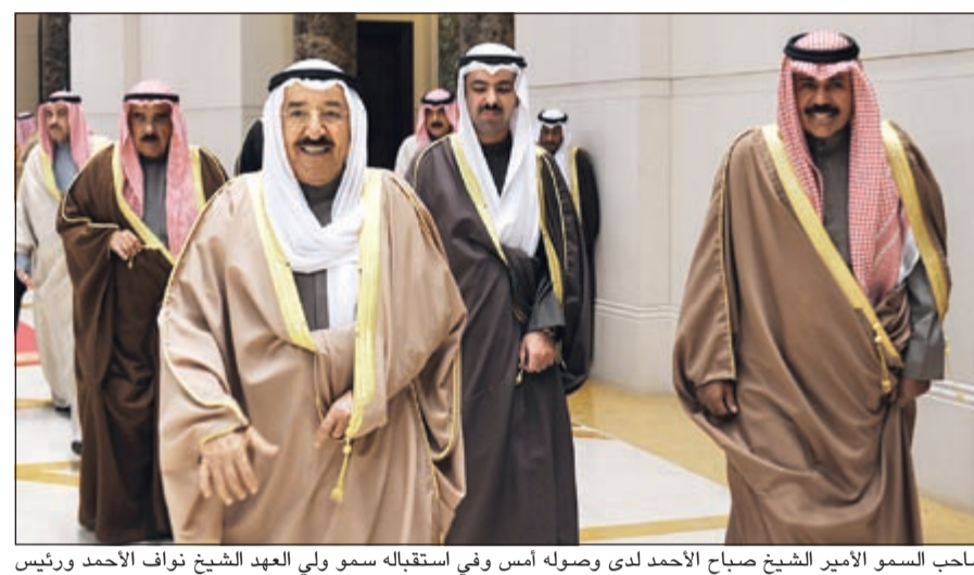
صاحب السمو الامير الشيخ صباح الاحمد لدى وصوله أمس وفي استقباله سمو ولي العهد الشيخ نواف الاحمد ورئيس مجلس الأمة علي الراشد وكبار الشيوخ والوزراء

فيما يمكن اعتباره تحفظا حكوميا على تصريح نائب رئيس الوزراء وزير المالية مصطفى الشمالي بأنه «ما عندنا شيء غير صندوق المعسرين»، جاء تصريح وزير الدولة لشؤون مجلس الوزراء ووزير الدولة لشؤون البلدية الشيخ محمد العبدالله امس حيث قال: موضوع شراء فوائد القروض مازال يدرس من قبل وزير المالية. ويسؤال مصدر وزاري رفيع عن مغزى تصريح الشيخ محمد العبدالله وهل هدفه امتصاص الغضب النيابية على تصريحات الشمالي ام شيء آخر، قال: بالتأكيد نحن نهدف الى دعم العلاقة الايجابية مع النواب. وفي الوقت نفسه قرر الحكومة النهائي حول المعالجة المثلى لفوائد القروض سواء بشرائها او عدمه لم يتخذ بعد، مازالنا ندرس مقترحات مطروحة من الحكومة والمجلس، وبإذن الله نتعالج الامر بعدالة وشفافية ومسواة بين المواطنين. وكان وزير الدولة لشؤون مجلس الوزراء ووزير الدولة لشؤون البلدية