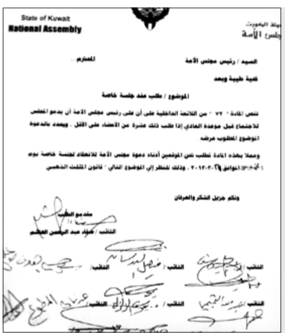
صورة زكروغرافية لطلب الجلسة الخاصة لمناقشة موضوع المثلث الذهبي

الكويت وبعض الدول متعلقة بالتعاون القانوني والقضائي والعسكري ونقل المحكوم عليهم وتسليم المجرمين وقمع الإرهاب، كما أقر المجلس المداولة الثانية للحلقة السنوية الثانية وأحالها الى الحكومة، واعتمد الاتفاقية الخاصة بتسوية ديون الخطوط الجوية العراقية المستحقة لتظهيرها «الكويتية»، وذلك بدفع مبلغ 500 مليون دينار لـ «الكويتية»، وأقر المجلس مرسوم الضرورة الخاص بتعديل أحكام قانون الرعاية السكنية. وكلف مجلس الأمة لجنة حقوق الإنسان بمتابعة مستجدات قضية معتقليننا في غوانتانامو.