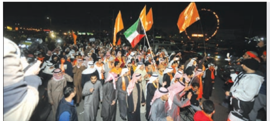
مئات من المتظاهرين احتشدوا في منطقة السباحية خلال مسيرة «كرامة وطن» 7 (سعود سالم - قاسم باشا - أسامة أبوعلية)

«كرامة وطن» 7 شهدت مواجهات مع القوات الخاصة في «الصباحية» 50