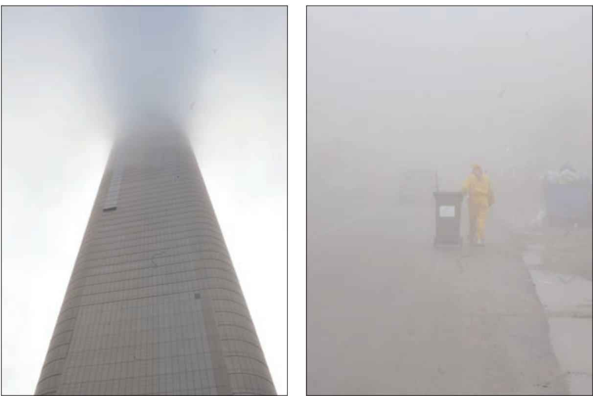
برج الحمرا وقد اخفي الضباب قمته انعدام شديد للرؤية في الكويت أمس