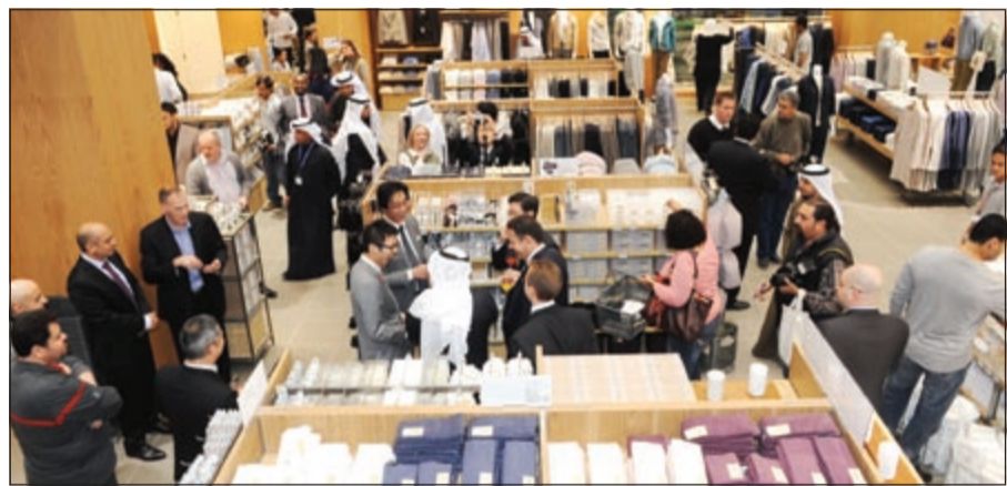
لقطة عامة لمتجر «موجي» في «غراند أفنيو»