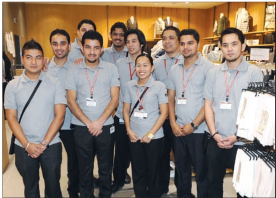
فريق عمل «موجي» في لقطة جماعية عقب الافتتاح

مختلف احتياجات أنماط الحياة العصرية. هذا وقد حضر مراسم قص الشريط للإعلان الرسمي عن افتتاح المحل كل من سفير اليابان في الكويت توشيhiro و تسوجيهارا، ورئيس شركة موجي ماساكي كاناي، ورئيس مجلس الإدارة التنفيذي محمد عبدالعزيز الشايح في شركة محمد حمود الشايح. من جانبه أشار رئيس شركة موجي اليابانية ماساكي كاناي إلى «إن تقديم منتجات تتماز بجودة الصنع والبساطة في الشكل مع المحافظة على ميزات العصرية والاناقة في التصميم وبأسعار تنافسية تلبي حاجة الزبائن هو من صميم سياسة شركة موجي والتزامها نحو عملائها. فبعد نجاحنا الكبير في اكتساب ثقة عملائنا في عدد من أسواق آسيا وأوروبا والولايات المتحدة الأمريكية، نحن على ثقة باننا سننال الشهرة ذاتها والثقة لدى الزبائن بمنتجاتنا في أسواق الشرق الأوسط وذلك من خلال تعاوننا مع شركة الشايح». ويتألف متجر موجي في «غراند أفنيو» من طابقين ويمتد على مساحة تقدر بـ 1000 متر مربع يقدم من خلاله لزبائنه ما يزيد على 3000 صنف من مختلف المنتجات العصرية والأنيقة المبتكرة والتي تتنوع في استخداماتها بين لوازم المنزل المختلفة من معدات المطبخ، وأواني وأطباق وإكسسوارات موائد الطعام، بالإضافة إلى مجموعات متنوعة من قطع الأثاث المنزلي والمفروشات وأنساث المكاتب وتشسيكلات متنوعة وزاهية من الملابس والأزياء.