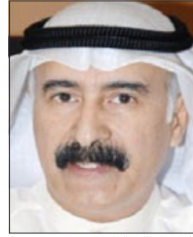
اللواء عبدالله الراشد

احال وكيل وزارة الداخلية المساعد لشؤون الهجرة والجوازات بالإنابة اللواء عبدالله الراشد امس مواطنًا لتورطه في الاتجار في الاقامات، كما امر اللواء الراشد بتعميم اسماء 152 وافد استفادوا من خدمات صاحب شركات وهمية جلبهم في مخالفة للقانون نظير مبالغ مالية تراوحت بين 1000 و1200 دينار حسب التحريات. وحسب مصدر امني فان معلومات ورتت الي وكيل وزارة الداخلية المساعد لشؤون الجنسية والجوازات عن ان هناك مواطنًا ذاع صيته في الاتجار باقامات وان هناك مندوبين يعملون لحسابه، حيث كلف ادارة البحث والتحري في الادارة العامة للهجرة بعمل