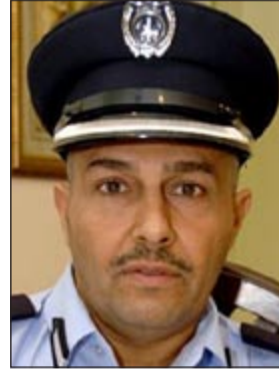
المقدم خليل الأمير

لقي آسيويان مصرعهما في منزل مخدومهما بمنطقة الفروانية اختناقاً جراء استنشاقهما الغاز المنبعث من دوة الفحم، وهي الحالة الثانية في أسبوع بعد الآسيوي الذي توفي لذات السبب في اسطبلات الجهراء. وحسب مصدر امني فان مواطنًا ابلى عمليات الداخلية ان الخاتمة ذهبت الى غرفة الوافدين لتقديم طعام الإفطار لهما إلا انهما لم يردا وهو ما دعاه الى كسر الغرفة التي يقيم بها الوافدان ليجهدا بلا حراك، وأشار المصدر الى ان مدير أمن الفروانية اللواء عبد الفتاح العلي انتقل الى موقع البلاغ الى جانب عدد من الألة الجنائية وتبين مصرعهما جراء الغازات السامة المنبعثة عن الدوة، وأشار المصدر الأمني الى ان