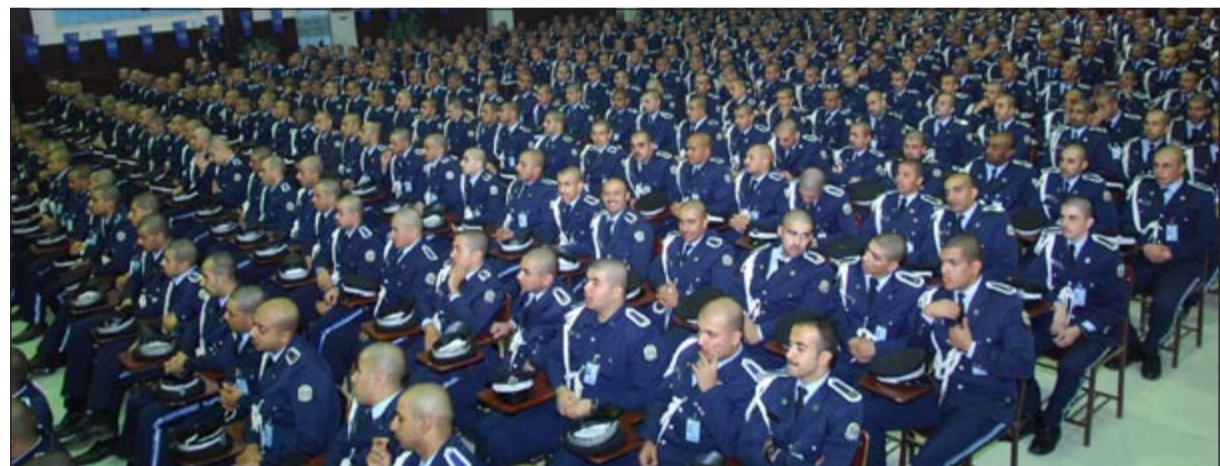
حضور حاشد في اختتام النشاط الثقافي والرياضي

وقام اللواء الشرقاوي بتوزيع شهادات التقدير والجوائز والسدوع على المشاركين الذين حققوا مراكز متقدمة في الأنشطة الثقافية والرياضية.