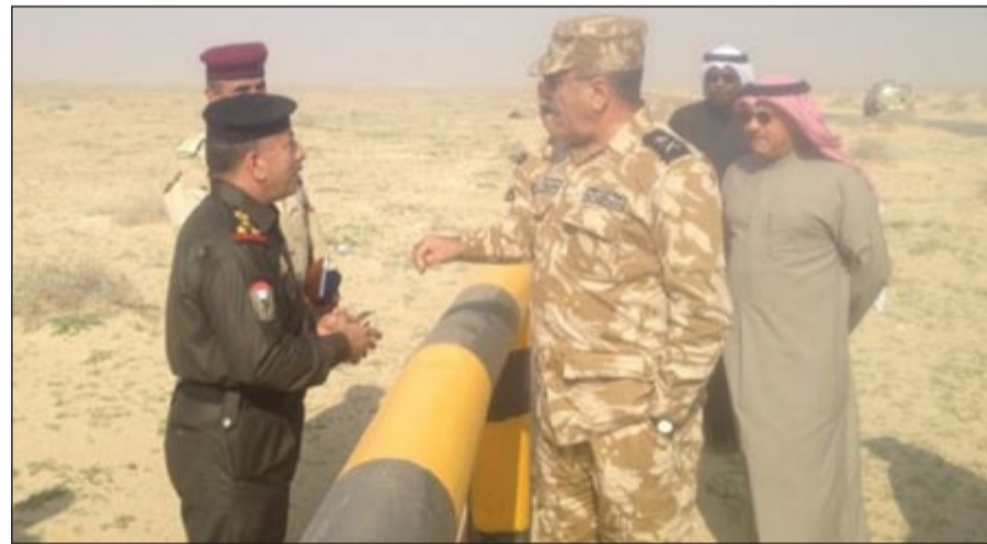
اللواء الشيخ محمد يوسف خلال الجولة على الحدود مصافحاً أحد الضباط العراقيين

من الإدارة العامة للحدود البرية المقدم عبدالله حمد بن مسامح.