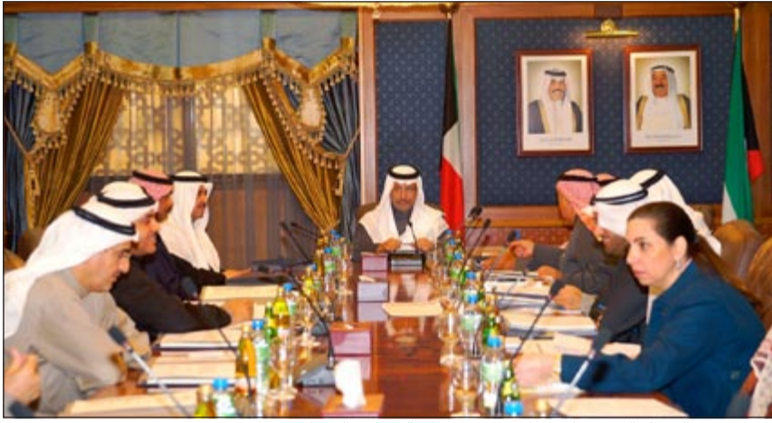
سمو رئيس الوزراء الشيخ جابر المبارك مترئسا جلسة مجلس الوزراء

استنكار الكويت وادانتها الشديدة لهذا العمل الإرهابي والاجرامي انطلاقا من