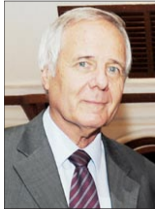
السفير الألماني فرانك مان

التي ستعقد في الرياض - المملكة العربية السعودية التي ستعقد في الرياض -