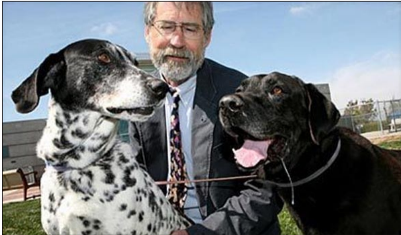
الرجل مع كلبيه

لمسلطات الأميركية من الرائحة المنبعثة من منزل الرجل. وقالت ماركيز ان صاحب المنزل الذي لم يتم الكشف عن هويته كان متعاونًا جدا مع السلطات وانه على الارجح أنقل من عدد الطيور والحيوانات التي رعاهما في بيته، وقالت «لقد أبلغنا بأنه أخذ بعض الحيوانات من أشخاص آخرين ومن