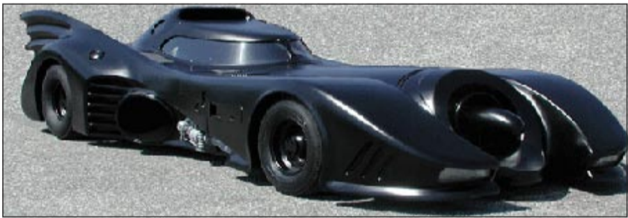
سيارة «الرجل الوطواط»

عرضها في دار مزاد باريث جاكسون اول من امس في مدينة سكوتسديل في أريزونا واشترها رجل أعمال من مدينة فينيكس. وكان مصمم السيارات الشهير في هوليوود جورج باريث صمم سيارة الباتمويل خلال 15 يوما فقط عام 1966، وقد كلفت نحو 15 ألف دولار عند صنعها باستخدام سيارة من نوع فورد فوتورا طراز العام 1955، وكانت السيارة ضمن مجموعة باريث منذ ذلك الوقت.