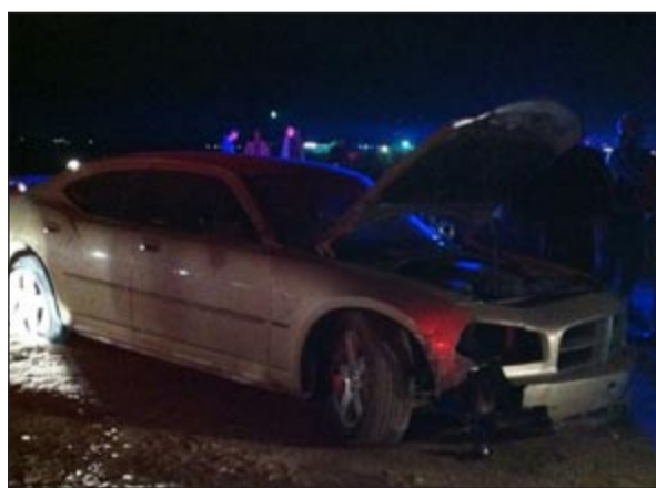
المركبة التي دهست الطفلين وهرب قائدها

أحال مدير أمن محافظة الجهراء اللواء إبراهيم الطراح حدثاً كويتي إلى النيابة العامة بتهمة القتل الخطأ والهراب، وكانت عمليات الداخلية تلقت بلاغاً في ساعة متأخرة من يوم أمس الأول عن اصطدام مركبة بطفلين على طريق المطلاع كيلو 15 وابتنقل رجال الأمن والأدلة الجنائية تبين مصرع طفليتين 4 و5 سنوات، ولدى الاستماع إلى إفادة الأب قال إن ابنه وطفلاً ثالثاً وخادمة إنيوية كانوا في طريقهم إلى بقالة متنقلة في المطلاع لتأتي مركبة وتصطدم بطفليهما، ونجت الخادمة وطفل ثالث، وأشار المصدر إلى أن الجاني ترك سيارته وهرب إلى جهة غير معلومة وبعد مرور أقل من ساعة على الحادثة حتى تم إبلاغ عمليات الداخلية بأن مواطناً يبلغ العمليات بأن ابنه هو الذي ارتكب الحادث وأنه سيسلمه إلى المباحث الجنائية خشية تعرضه للذلي.