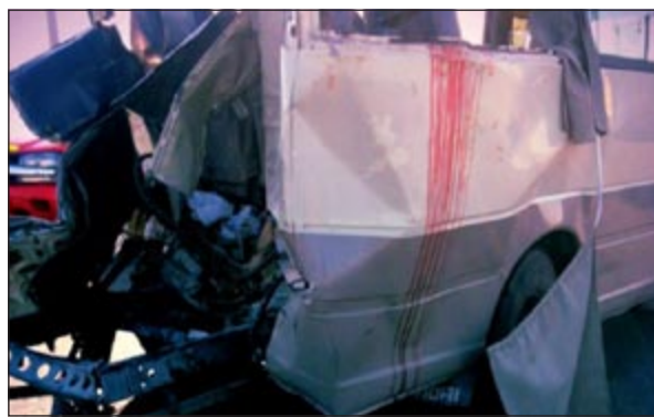
آثار الدماء على الباص

شهد طريق الشعبية عصر أمس حادثاً مروعاً أسفر عن مصرع وإصابة 19 شخصاً جميعهم من الوافدين، وقال المنسق الإعلامي في إدارة الطوارئ الطبية عبدالعزيز بوحيمد إن بلاغاً تلقت إدارة الطوارئ في صباح أمس تضمن وقوع حادث تصادم بين باص وشاحنة.