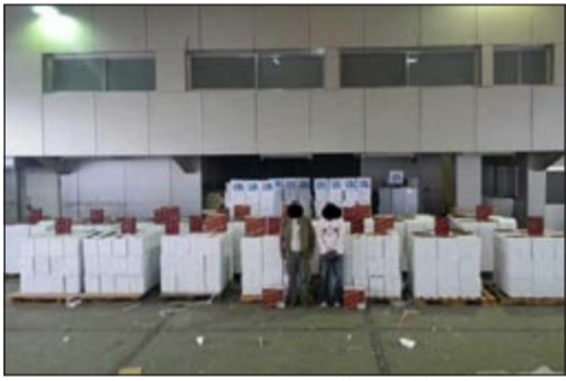
التمهات وحفظها المضبوطات

في إطار الجهود التي تقوم بها الإدارة العامة لمكافحة المخدرات في تعقب وضبط تجار ومهربي ومروجي المخدرات والخمور تمكنت إدارة العمليات من ضبط عدد 630 كرتون من المشروبات الروحية نوع رديليل (أي ما يعادل 7560 زجاجة) وقالت وزارة الداخلية في بيان لها أن معلومات سرية وردت إلى الإدارة العامة لمكافحة المخدرات تفيد بوجود حاوية في ميناء الشويخ قادمة من دولة خليجية تحتوي بداخلها على كمية كبيرة من المشروبات الروحية وبالتحري عن الأوراق الخاصة بالحاوية تبين أنها مزورة وعليه تم التنسيق مع مكتب التحري الجمركي وجمارك الشويخ لتسهيل خروجها ومتابعتها وبالفعل تقدم أحد الأشخاص من الجنسية العربية وقام بإنهاء إجراءاتها وتسلمها وتم خروجها ومراقبتها لحين وصولها لإحدى الساحات الترابية وترجل منها وبعد مراقبته تم ضبطه واعترف بأن الحاوية لأحد الأشخاص من الجنسية العربية والذي غادر البلاد قبل إنهاء إجراءات خروج الحاوية وتم تكثف المراقبة على الحاوية فحضر شخص من الجنسية الآسيوية وقام بفتح الحاوية وأثناء ذلك تم ضبطه واعترف بأنه حضر لنقل الخمور من الحاوية إلى شاحنة أخرى لتخزينها وبالحث والتحري تبين أن من قام بإرسال الآسيوي هو شخص من أرباب السواقي في حقل جلب المشروبات الروحية كويتي الجنسية وجار ضبطه.