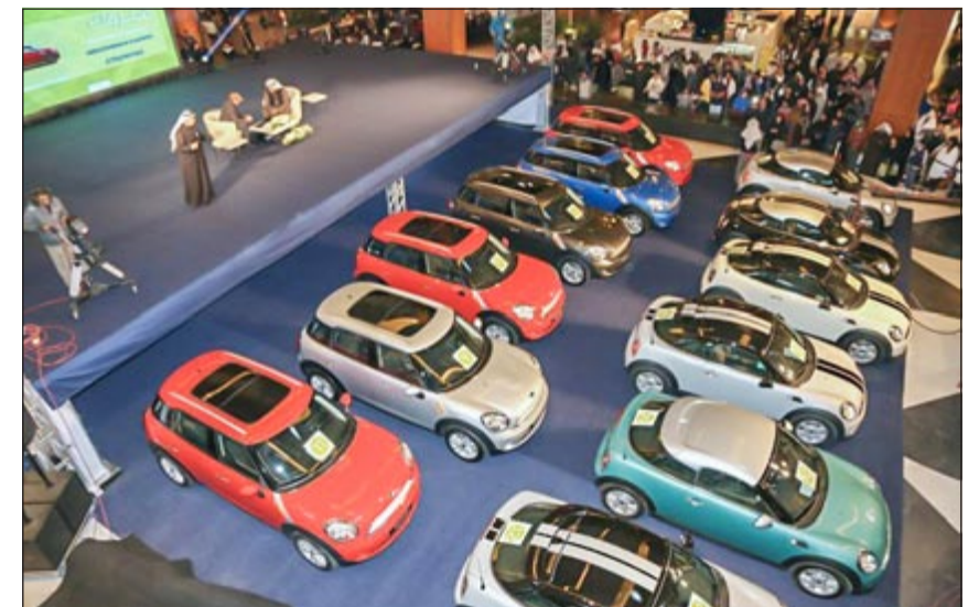
سيارات ميني كوبر