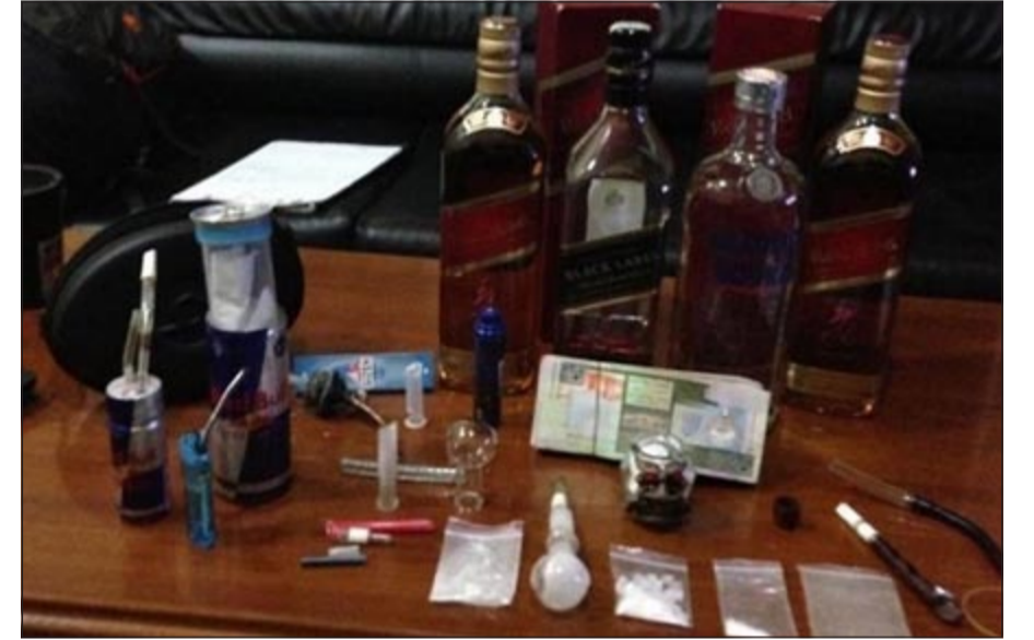
كمية المضبوطات المنوعة مع المواطنين

تمكن رجال نجدة محافظة حولي من ضبط مواطنين وبحوزتهما كوكيل ممنوعات وتمت إحالة المتهمين الى جهة الاختصاص. وقال مصدر أمني ان رجال النجدة اشتبهوا بمركبة أميركية مساء أمس الأول، وبالطلب من سائقها التوقف حاول الفرار إلا أن رجال النجدة