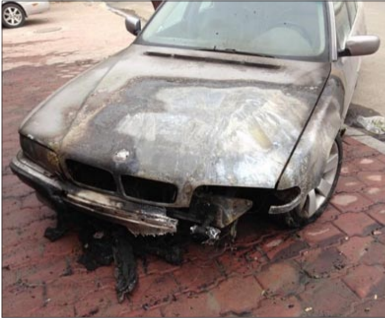
سيارة الزميل سعود سالم وتبدو عليها آثار الحريق