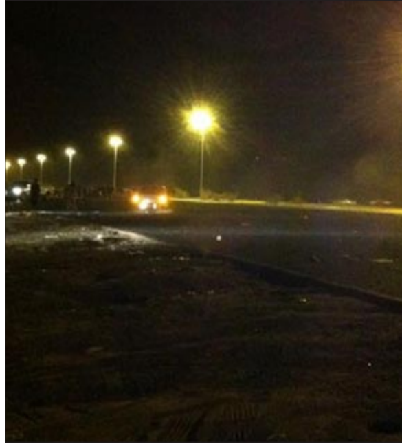
إغلاق الطريق بالكامل لأحد المستهترين ليقوم بوصول استعراض