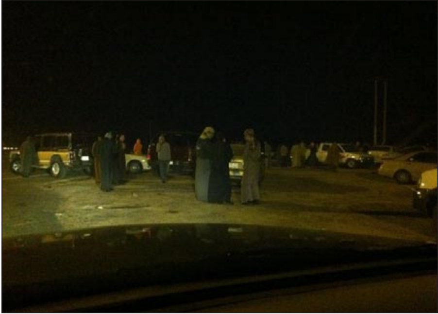
جانب من جمهور الاستعراض على جانبي الطريق