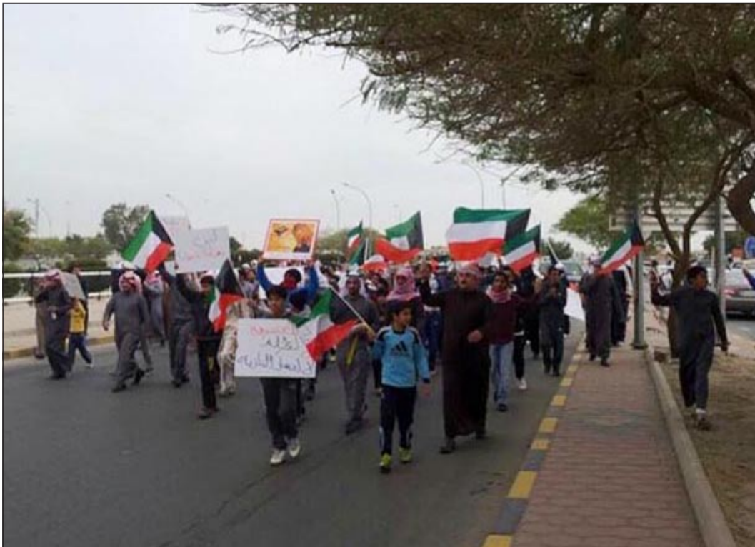
مقدمة تظاهرة البدون في تيماء أمس

الرئيسي في المنطقة. وأشار المصدر الى انه بعدما قام المتظاهرون بتعطيل حركة السير تم طلب حضور القوات الخاصة احترازا قبل أن يتم فض التظاهرة بشكل ودي. هاني الظفيري