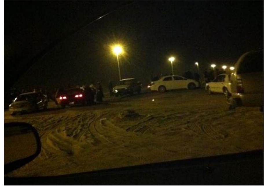
عدد من سيارات متابعي وصلة استعراض طريق السالمي

عن المناطق السكنية وتوجه الى الطرقات البعيدة كطريق السالمي والعبدي والوفرة لممارسة هوايتنا».