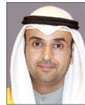
د. نايف الحجرف

وزارة التربية بالخصم مقابل الإجازات لجميع موظفيها يخالف القانون رقم 28 لسنة 2011م الخاص بكادر المعلمين وبإتالي يعكس ما تم الاتفاق عليه بين الجمعية ومجلس الخدمة المدنية بتاريخ 23 سبتمبر الماضي والذي يتضمن إلغاء المذكرة الصادرة من ديوان الخدمة المدنية بشأن أحكام قانون كادر المعلمين المؤرخ بتاريخ 20 فبراير الماضي بناء على رأي الفتوى والتشريع بكتابه الوارد تحت رقم 2012/92/2م والذي تضمن أن بسد التخصص النادر ومكافأة المؤهل العلمي وبديل التدريس لا يجوز إلغاؤها أثناء جميع الإجازات، وأوضحت الجمعية في مذكرتها أن سبب عدم ذكرها في المادة السابعة