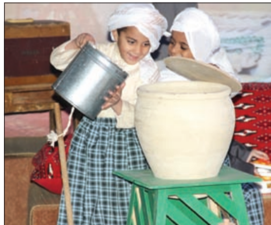
إحدى فقرات الورشة

وأشاد جمعة بجهود وزارة التربية بتوفير نشاط البولنغ بالمجان للطلبة، مبيناً الإقبال على المركز في تزايد، كما أثنى على فكرة الأندية المسائية التي بدأت بناء على رغبة أميرية من صاحب السمو الأمير الشيخ صباح الأحمد عندما كان سموه رئيساً لمجلس الوزراء، مشيراً إلى أن الأندية تحتوي على مجموعة من الأنشطة الطلابية المتنوعة التي تهدف إلى استثمار أوقات الفراغ وصقل المواهب الإبداعية وتنمية القدرات البشرية، وذلك وفق