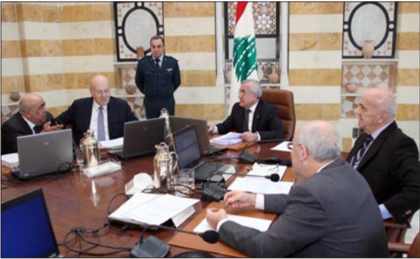
جانب من جلسة مجلس الوزراء في بعيدا أمس

سيتولى طرحه الرئيس بري عبر حركة اتصالات تشمل لقاء وشيكا مع الرئيس فؤاد السنيورة وتهدف الي خفض عدد المقاعد النيابية على أساس النسبية من 77 إلى 64، بحيث يصبح المجلس منتخبا مناصفة بين النسبية والأقترية.