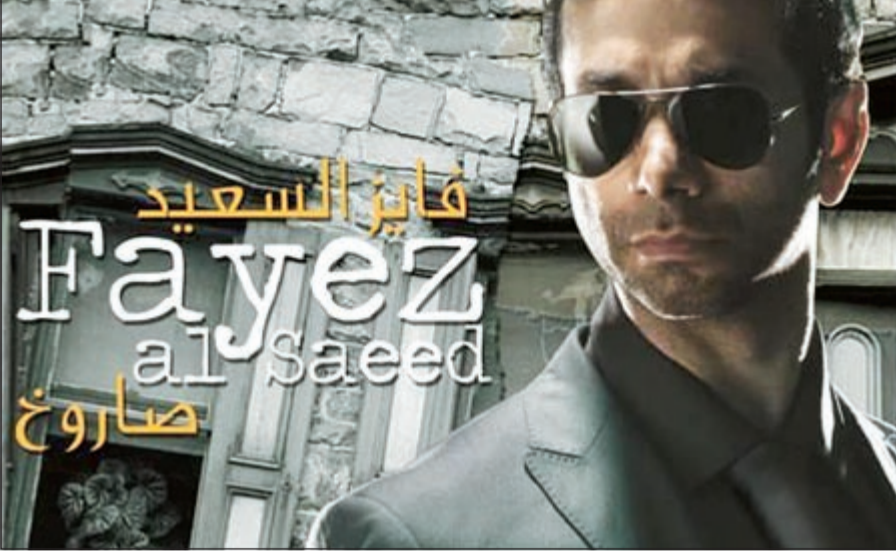
بوستر اليوم «صاروخ»

محمد، «الصرافة» كلمات تركي الشريف، أحان وليد الشامي، وأغنية ديو بين