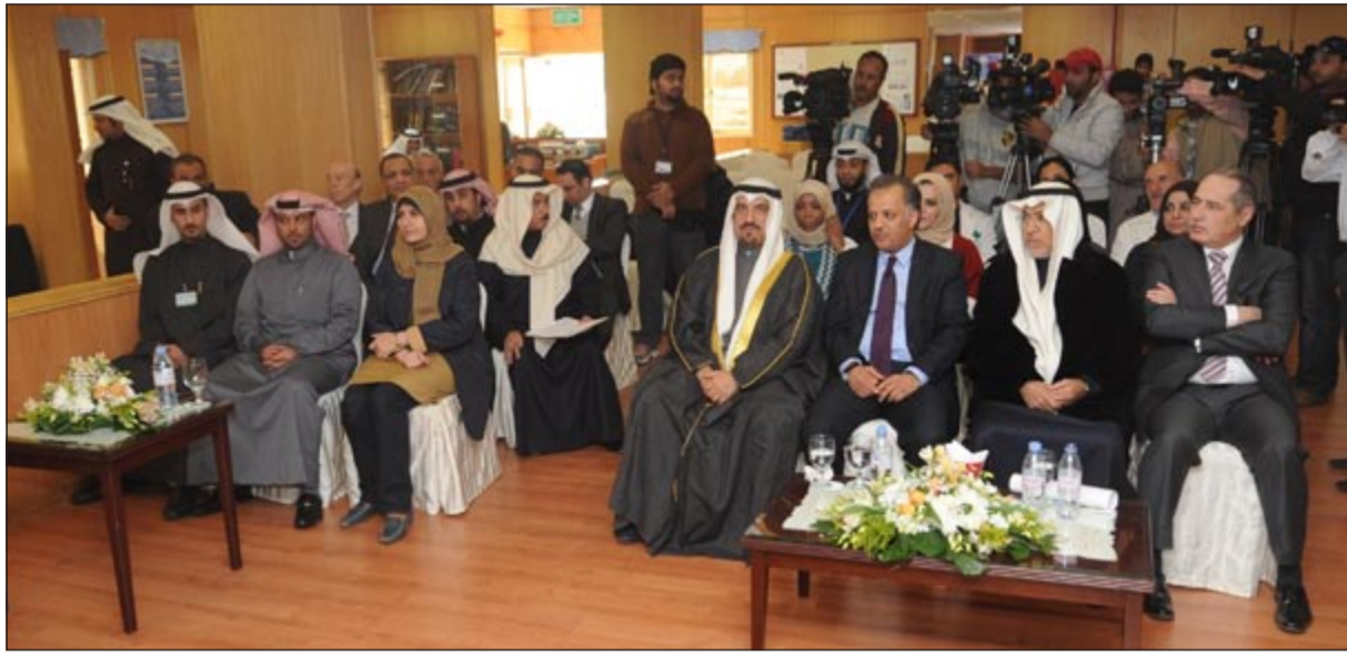
متابعة من الحضور للمتحدثين خلال حفل الافتتاح

خلال جولة بعد وضع حجر الأساس لمبنى توسعة الأجنحة الجديد «برج الرازي» بمنطقة الصباح الصحية