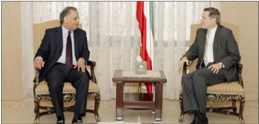
وزير الصحة د.محمد الهيبي خلال لقائه مع السفير الأميركي ماثيو تولر

أصدر وزير الصحة د.محمد الهيبي امس حزمة من القرارات الوزارية تضمنت ضم بعض الأسماء الى لجان وطنية عليا، وندب أطباء، بالإضافة الى تشكيل لجان تصفية. وفي خطوة تعد الأولى من نوعها جاء القرار رقم 9 لسنة 2013 الذي قضى بضم وزير الصحة السابق د.علي العبيدي الى عضوية اللجنة الوطنية العليا لرعاية كبار السن بصفته ممثلا عن المجتمع المدني وبموجب القرار الوزاري رقم 110 لسنة 2012.