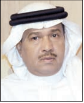
فنان العرب محمد عبده

فيه عبده: «مريم حسن كانت تبحث عن الاضواء وحققت ما تريد».