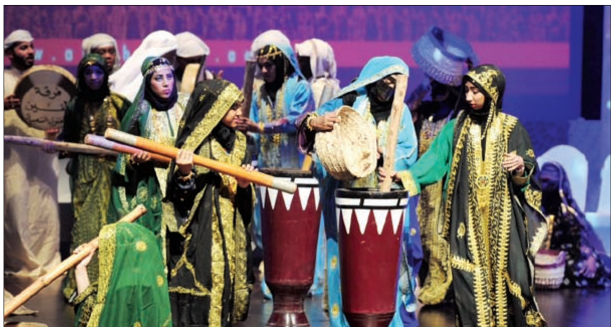
جانب من حفل الختام