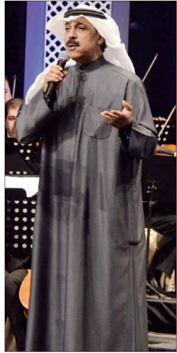
سفير الاغنية الخليجية عبدالله الرويشد

ضمن أنشطة مهرجان القرن الثقافي التاسع عشر اقيمت مساء امس الاول امسية الطرب الكويتي على خشبة مسرح الدسمه بحضور الإصين العام للمجلس الوطني للثقافة والفنون والآداب م.علي اليوحة وحشد كبير من عشاق الطرب الاصيل والاغاني الكويتية الجميلة بقيادة المايسترو د.محمد باقر وفرقة الموسيقية.