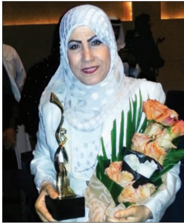
.. والفنانة القديرة مريم الصالح مكرمة