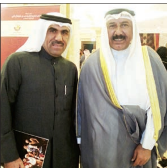
الزميل مفرح الشمري مع السفير علي سلمان الهيفي

قام سفير دولة الكويت في الدوحة علي سلمان الهيفي بدعوة الوفد الكويتي على الغداء في منزله وقد حضر جميع المشاركين في الوفد تلبية لدعوة السفير، حيث وجهوا له الشكر على هذه المبادرة الجميلة كما شكروه على حضوره للعرض الكويتي وحرصه على متابعة كل صغيرة وكبيرة فيما يخصهم، متمنين له التوفيق في عمله.