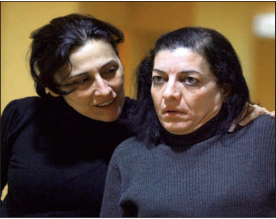
مشهد من مسرحية «الديكتاتور» اللبنانية الفائزة بجائزة حاكم الشارقة لـ «المسرح العربي» الـ 5