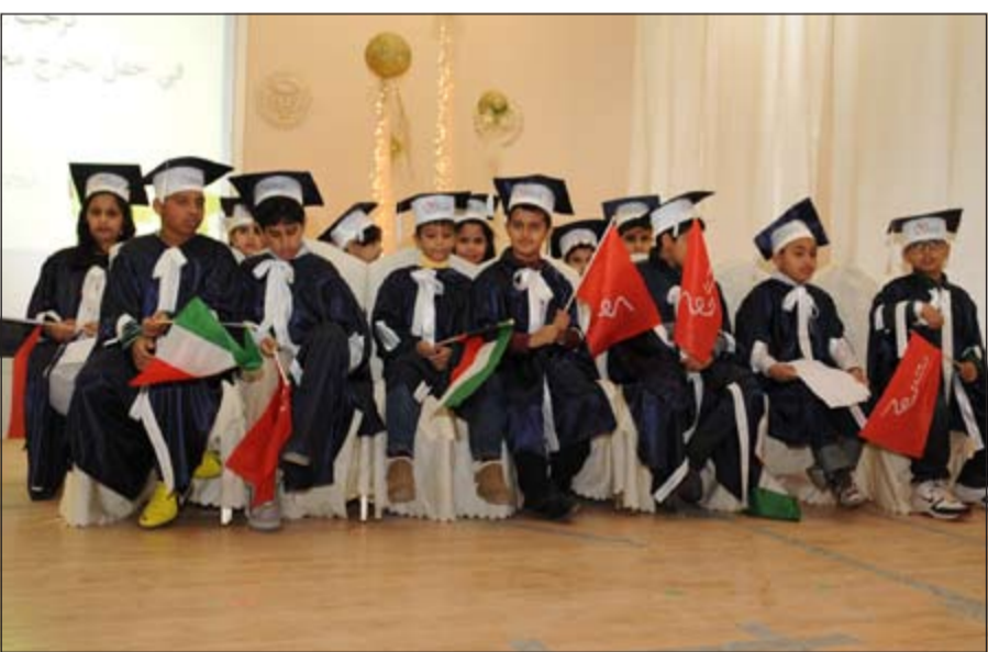
مجموعة من الأطفال الذين تم تخريجهم