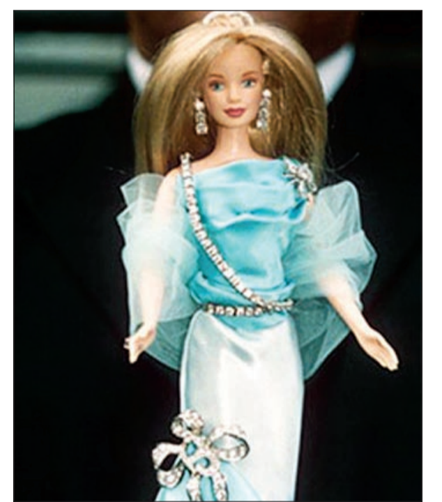
باربي المرصعة بالألماس

العربية. نت: انفق النجمان بيونسيه وجاي زي نحو 80 ألف دولار لشراء دمية «باربي» مرصعة بالمجوهرات لطفلتها «بلو آيفي» في عيد ميلادها الأول. وأفادت صحيفة «صن» البريطانية أن بيونسيه وجاي زي احتفلا بعيد ابنتهما الأول ودفعا ما يقارب الـ 80 ألف دولار لشراء «باربي» مرصعة بالألماس، واستخدمت 160 حبة ألماس في «باربي» بالإضافة إلى الذهب الأبيض، وفق الصحيفة، وأقام النجمان حفلا كبيرا في نيويورك بمناسبة عيد ميلاد ابنتهما ودفعا 2400 دولار ثمن قالب الحلوى، فيما كلفتهم الورود البيضاء والزهرية نحو 97 ألف دولار، كما انفقوا أكثر من 32 ألف دولار لشراء ألعاب لضيوف طفلتها الصغار، فيما حصل الضيوف الراشدون على حقائب تحتوي على تذاكر لحفلاتها، وأقلام خُفر عليها اسم الصغير واسم