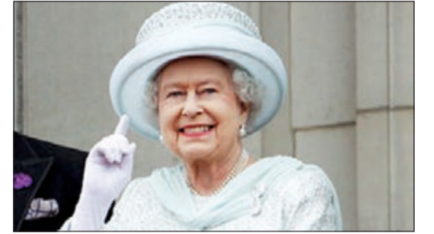
ملكة بريطانيا إليزابيث الثانية

لسندن - يو.بي.أي: تعطلت سيارة ملكة بريطانيا إليزابيث الثانية من طراز بنتلي رولز رويس خلال زيارتها لقرية ساندرينغهام في مقاطعة نورفولك لاداء الصلاة في كنيسةها. وقالت هيئة الإذاعة البريطانية (بي بي سي) أمس ان السائق لم يتمكن من تشغيل السيارة والتي كان يصدر من محركها صوت صرير وضوضاء ما أثار ضحك الملكة البالغة من العمر 86 عاما. وأضافت ان اسقف الكنيسة ستيفن كوتريل تقدم لمساعدة السائق من خلال منح